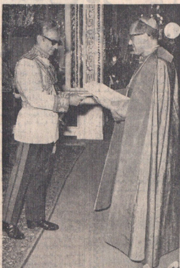
«ارتسوکالینا» سفیر جدید واتیکان در دربار شاهنشاهی دیروز طی مراسمی بظهور شاهنشاهی پادشاهان اسوار نامه‌های خود را به پیشگاه ملوکانه تقدیم کرد. عکس سفیر جدید را هنگام تقدیم اسوار نامه به پیشگاه شاهنشاهی نشان میدهند.