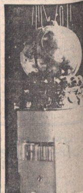
تصویر ماهواره سوزوکی ۱۱ که از فضا برای اکتشاف زمین و فضا می‌برد.

با الحاق سبوز ۱۱ به سالیوت ایستگاه فضائی تکمیل خواهد شد