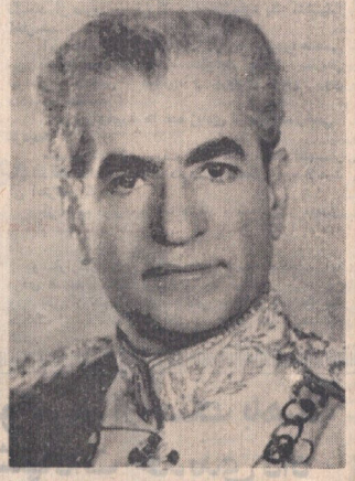
وزیر دربار شاهنشاهی تلگرامی به خانواده شهبای قیام ۲۸ مرداد مغایره کرد برنامه رژه واحدهای نمونه ارتش در خیابانهای تهران در صفحه ۴ سر مقاله امروز درباره قیام ملی ۲۸ مرداد در صفحه دوم چاپ شده است