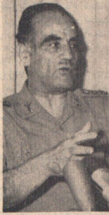
تیمسار سپید صدی رئیس شهربانی کل کشور

● تاکسی ها و کرایه ها بیشتر از همه خلاف میکنند ● در محله‌های که خط‌کشی نشده عابر را جریمه نمی‌کنیم ● قانون جدید طی مراحل مختلف وقتی اجرا می‌شود که وسائل و عوامل اجرای آن فراهم شده باشد ● مقررات جدید رانندگی برای نواحت کردن راننده‌ها نیست ● در صفحه ۴