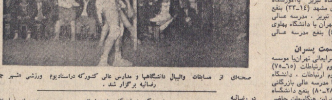
مجموعه از مسابقات والیبالی دانشگاهها و مدارس عالی کشور که در اصفهان برگزار شد.

دختران تیم بسکتبال اصفهان در مسابقات کشوری در شهر تهران موفق شدند تیم قهرمان سال گذشته را شکست دهند.