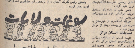
مجموعه از مسابقات والیبالی دانشگاهها و مدارس عالی کشور که در اصفهان برگزار شد.

دختران تیم بسکتبال اصفهان در مسابقات کشوری در شهر تهران موفق شدند تیم قهرمان سال گذشته را شکست دهند.