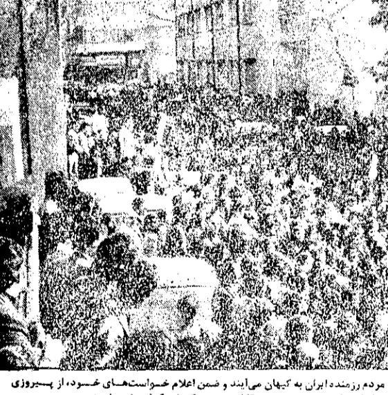
تجزیل مردم از کین روز گزوه‌های کنیزی از مردم زنده ایران به کیهان می‌آید و ضمن اعلام خواسته‌های خود، از پیروزی مطبوعات بر سانسور تعلیل می‌کنند.