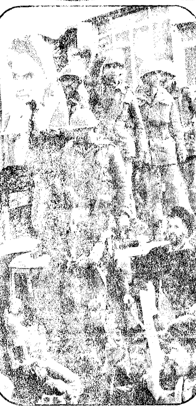
پیوند مردم و ارتش

سرهنک مار تین بروکوتز در حالیکه گولوش پاره شده و زخمی عمیقی بر روی سینه و سرش پاره شده بود در کمان کشته شد.