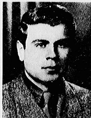
رفیق شهید، جهانگیر باغدیانیان