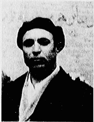
رفیق شهید آرسن آوانسیان