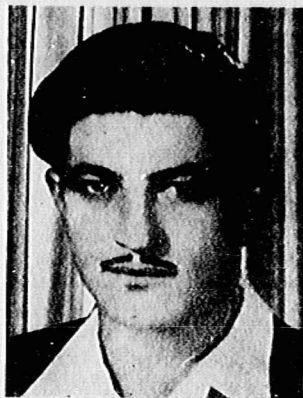
رفیق شهید، وارطان سلاخچیان