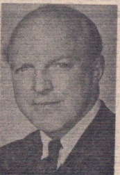
سر ہارولڈ کاجیا

وئیس مجلس عوام وئیس سابق مجلس عوام وئیس مجلس لردھا نخست وزیر اسبق وزیر امور خارجه و امور کشورہای مشترکہ المانغ دختر حزب لیبرال وزیر خالص سازی و ساختمان وزیر کشور وزیر دفاع وئیس گروه پارلمانی انگلیس و ایران معاون نائب وزارت امور خارجه و امور کشورہای مشترکہ المانغ وئیس سرویس دیپلماتیک وئیس انجمن ایران شہرداد لندن وئیس آکادمی سلطنتی انگلستان عضو ہیئت وئیسہ انجمن ایران سفر سابق انگلستان دو ایران سفر سابق انگلستان دو ایران سفر « ایش کالج » ناشر و مدیر مطبوعات « تابز » ناشر و مدیر « ایونینگ نیوز » وئیس شرکت بریتیش پترولیوم مدیر عامل شرکت بریتیش پترولیوم وئیس ہیئت مدیرہ بریتیش پترولیوم مدیر بریتیش پترولیوم مدیر موزہ ویکتوریا و آلبرٹ استاد ایران شناسی استاد کالج سنت آنتونی اسکرف مدیر شرکت « بریتیش لیلاند مونوز » مدیر شرکت وئیس شورای فرهنگ بریتانیا مدیر بانک انگلستان برای خاورمیانہ دانشمنہ ایران شناسی از استیتوی ایران شناسی بریتانیا دانشمنہ ایران شناسی دانشمنہ ایران شناسی وئیس استیتوی ایران شناسی بریتانیا