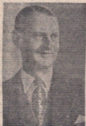
سر جفری ہرسن