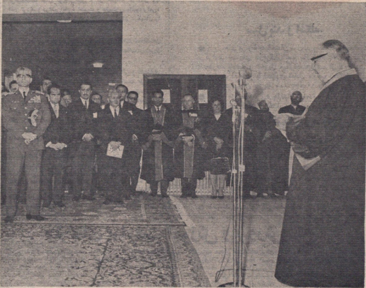
۱۶ فروردین ۱۳۴۴ دانشکده جدید علوم مشهد در پیشگاه شاهنشاه گشایش یافت