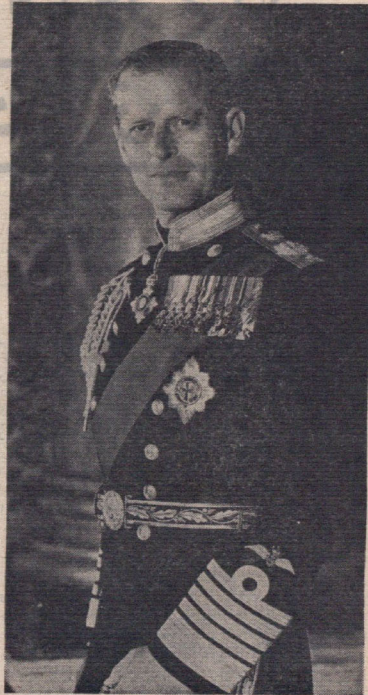
والاحضرت پرنس فیلیپ

آقای بزیل گری آقای بزیل دینسن آقای دیوید اسٹیل آقای جان گارنی