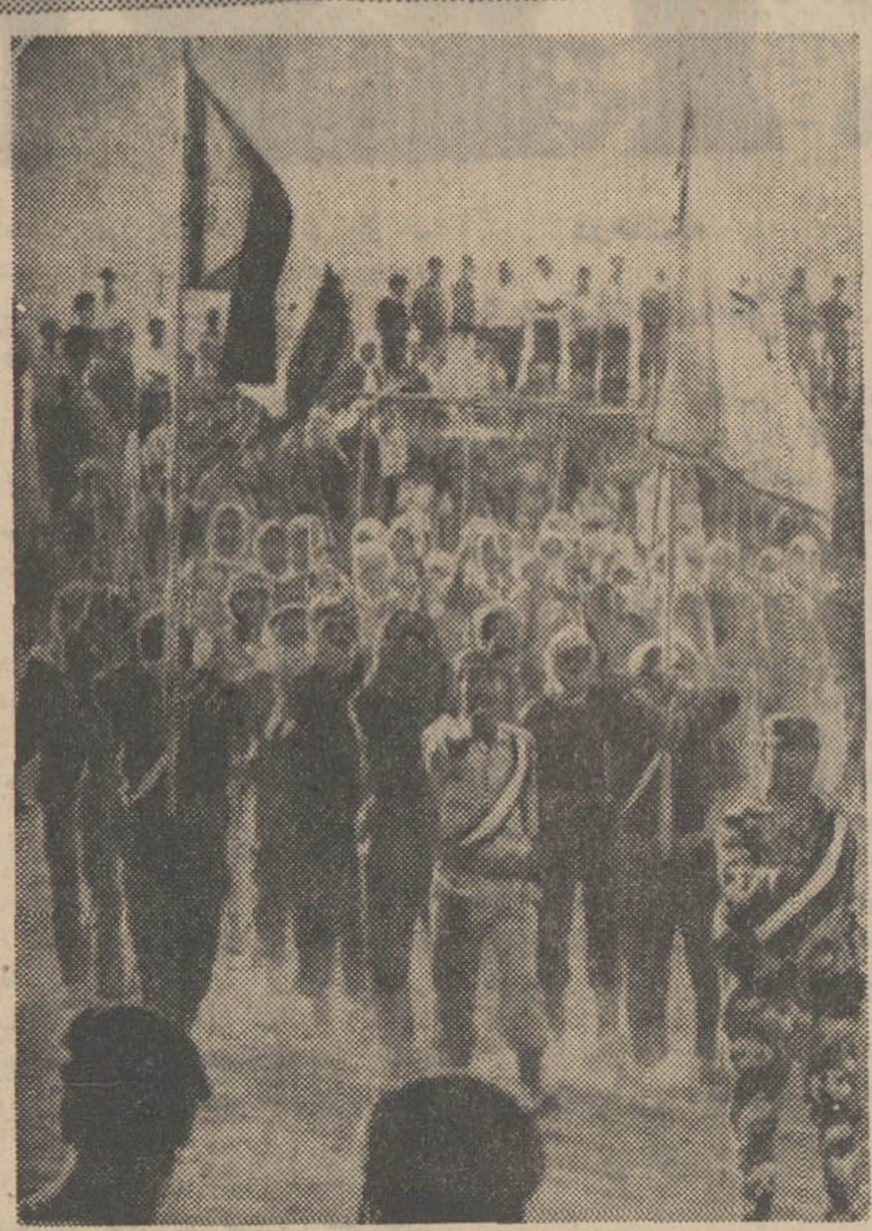
کماندو های فلسطین در اردوگاهی نزدیک عمان