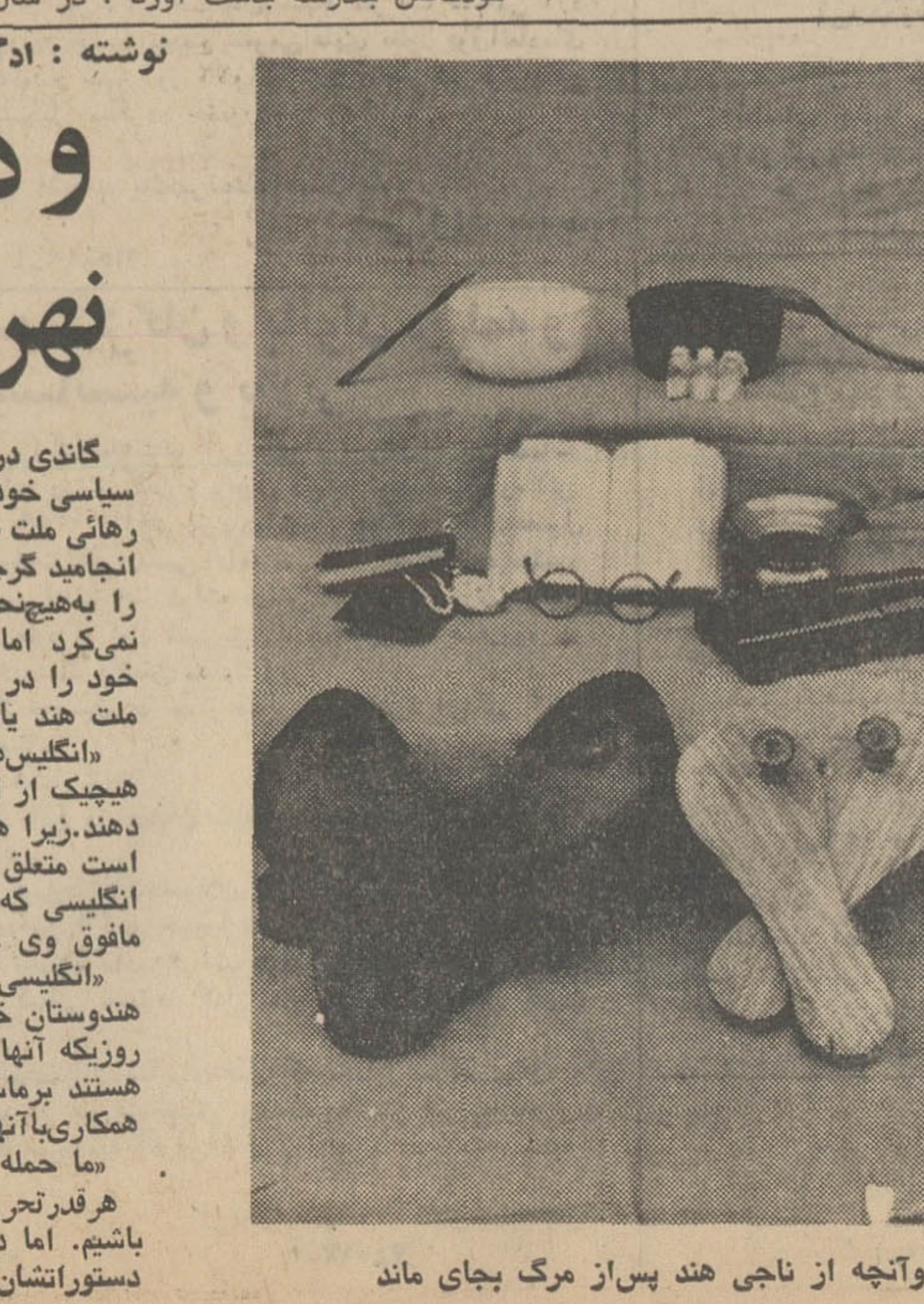
و آنچه از ناجی هند پس از مرگ بجای ماند

خود این موضوع را با او در میان گذاریم. وی گفت من نمی-گذارم برای ظاهر شدن در تلویزیون صورت مو «توال» کنند. من به صورت «گلدامایر» با دقت نگاه کردم و متوجه شدم که او وقتی در صرف ایستادن در مقابل آینه نمی-کند.