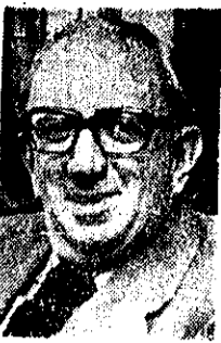
هانری سیمون وزیر خارجه بلژیک

هانری سیمون وزیر خارجه بلژیک روز یکشنبه در تهران اعلام کرد که بلژیک از مقامات عالی رتبه کشور خود برای یک بیستاد رسی از ایران به تهران می آید و در آستانه سفر هانری سیمون به ایران، مارسل وان دوگرتف سفیر بلژیک در تهران طی مصاحبه ای با خبرنگار کیهان اعلام کرد که هانری سیمون در طول اقامت خود در تهران در زمینه گسترش همکاری های همد جانبه ایران و بلژیک با مقامات ایرانی مذاکره خواهد کرد.