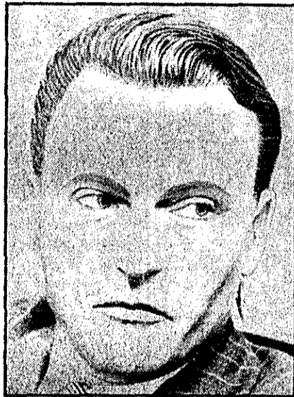
ادوارد امین، میلیاردر ربوده شده

میلیاردر ربوده شده میخواست در ایران نیروگاه اتمی بسازد