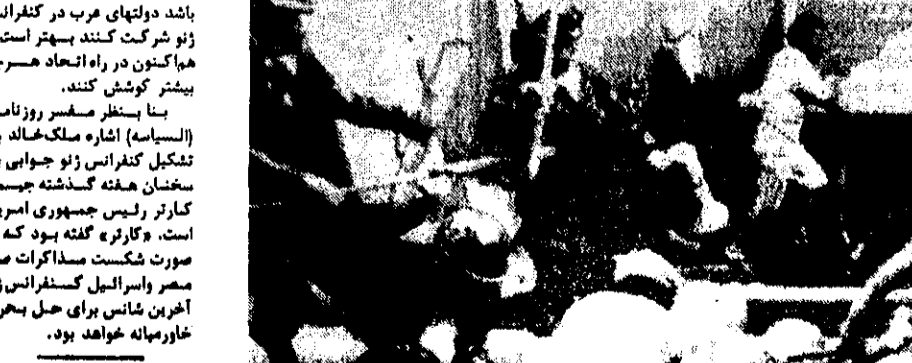
سختی از سربد پلیس ژاپن با معالمان فرودگاه جدید توکیو.

سالیسبورگ - اسوشیتد پرس - یک سخنگوی رودزیا اعلام کرد که شنبه شب چریکها چهارده سیاهپوست را که پنج نای آنها کودک بودند در زمزمستان در شمال رودزیا، ۲۰۰ کیلومتری شرق سالیسبورگ، به قتل رساندند. یک کشته‌شده‌گان از افراد یک خانواده بودند. مقامات رودزیا هفت نفر دیگر را کشته و چهارده نفر دیگر را به یک خانواده هفت نفری سیاهپوست را کشته و اجساد آنها را به درون یک کلبه در حال اشغال انداختند.