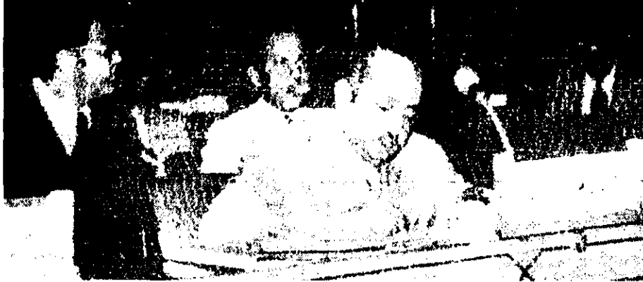
عبدالله الاصنع، وزیر خارجه یمن شمالی در کنفرانس فوق‌العاده وزیران خارجه عرب دیده می‌شود. او در این کنفرانس خواستار اخراج یمن جنوبی از جامعه عرب شد. یمن شمالی یمن جنوبی را به دست داشتن در قتل الغشمی رئیس‌جمهوری یمن شمالی متهم کرده است.

رومانه گویت گزارش داد از ژنرال شادلی، رئیس‌جمهوری سئاد ارتش مصر، حاضر شده است به نیروهای چریکی فلسطینی آموزش بدهد. روزنامه الوطن نوشت ژنرال سعدالدین شادلی، که اخیراً به سبب حمله عسکی به سادات از مقام معاونت در اردیبه‌ماه نیز برکنار شده، حاضر شده است به نیروهای چریکی فلسطینی بپردازد و به کوشش‌های آموزش بدهد.