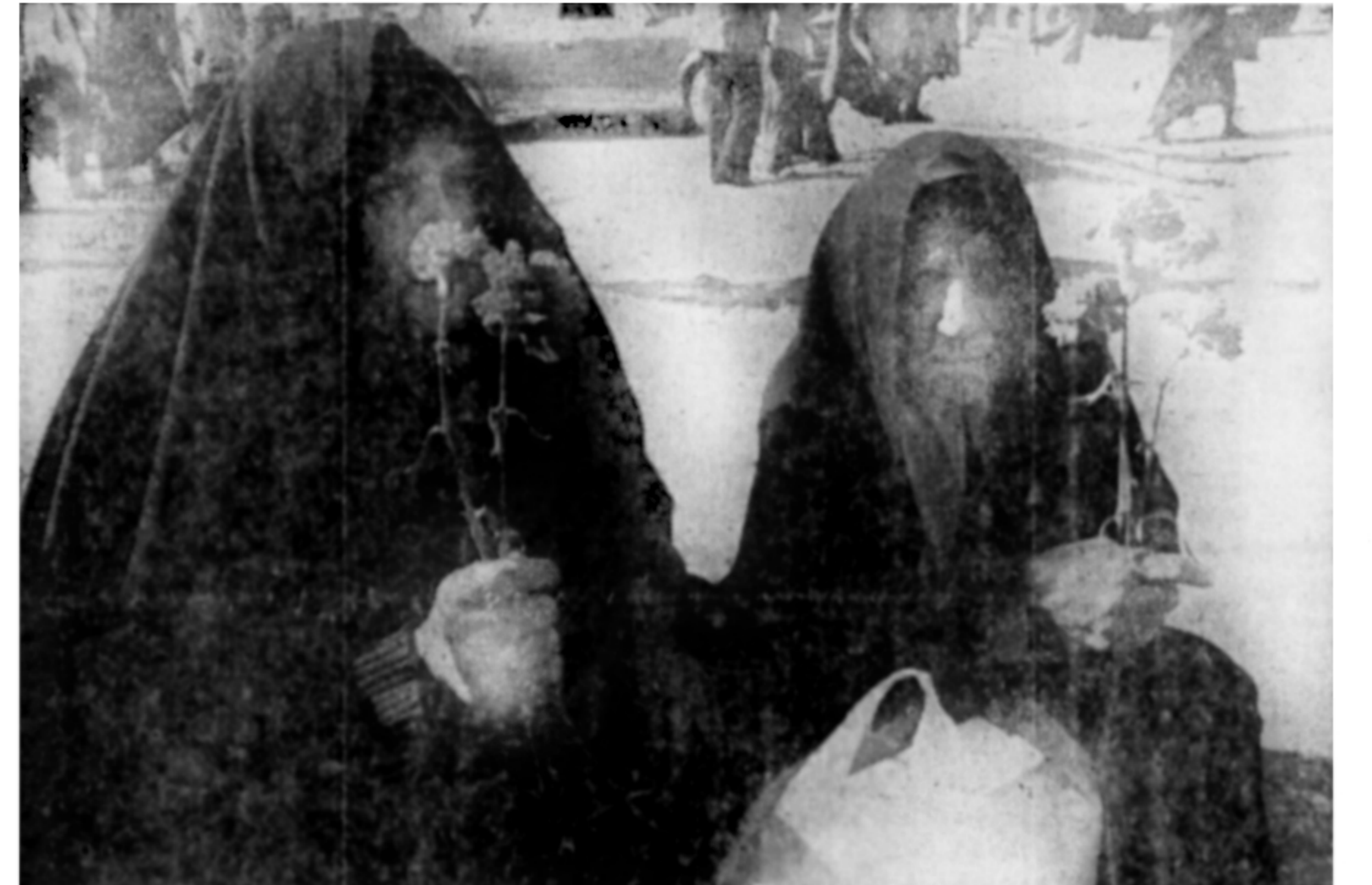
بجایرم ۱۳ بدر های گذشته کشتکی از آن گرزمن سیزه بود، مادر دادغیده بر مزار فرزند شهیدش لاله میگارد

۲ نفر کشته و ۱۰ نفر مجروح شدند اعلامیه حزب دمکرات کردستان در باره وقایع اخیر