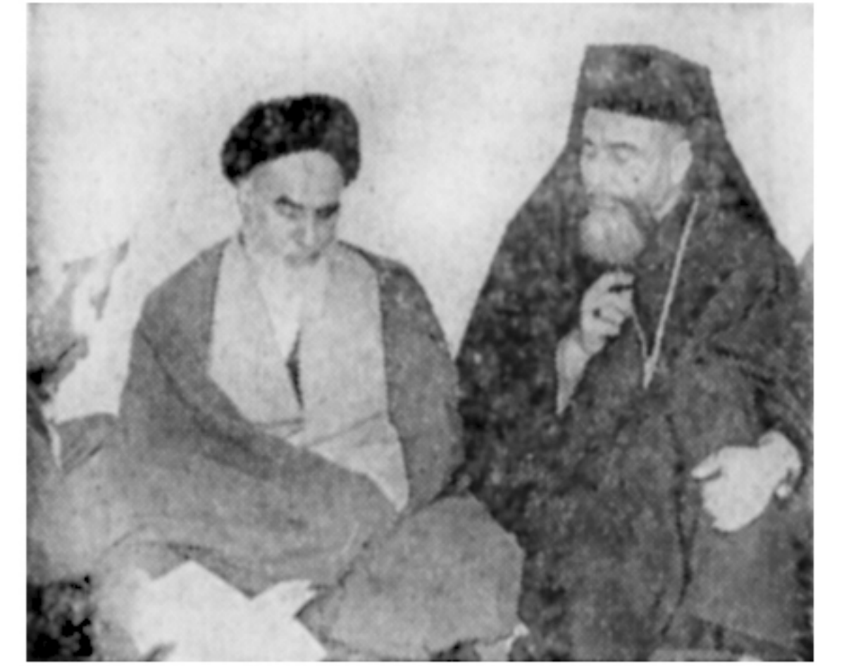
اسقف کاپوچی عضو افتخاری انجمن در حضور امام خمینی از خبرنگاران اطلاعات در قم

چرا طرفداران حقوق بشر در مورد جنایات پهلوی چیزی نمی‌گویند؟ پژآنکه باید محاکمه شود متهم است، گسانی که کشته شدند مجرم بودند