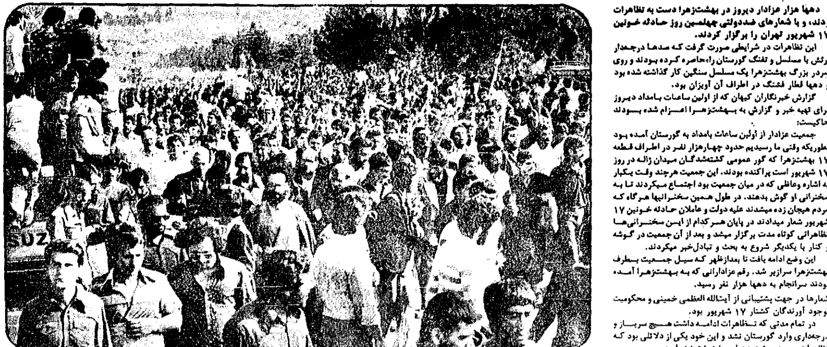
دیروز هزاران نفر از جمله خانواده های سیاهپوش و داغدار که عزیزان شان را در درویدهای خونین ۱۷ شهریور از دست دادند، در بهشت زهرا اجتماع کرده بودند.