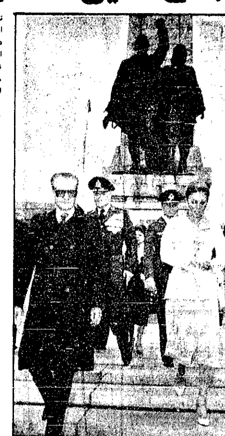
شاهنشاه آریامهر و علیاحضرت شهبانو در صحنه پس از افتتاح این شهر دین فرمودند.