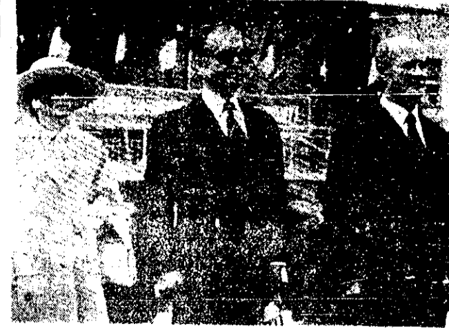
شاهنشاه آریا مهر و علیاحضرت شهبانو هنگام پذیرایی در تالار پارس در سال ۱۳۰۷

متن پیام شاهنشاه و سخنان نخست وزیر در مراسم نخستین شورای مرکزی حزب در صفحه ۲ چاپ شده است.