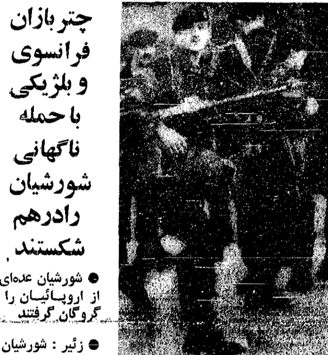
جنگجویان مسلح بلژیکی، در فرودگاه بروکسل معتقدند تا با هواپیما به زئیر برده شوند. فرانسه نیز به مانند بلژیک برای سرکوبی شورشیان زئیر، به این کشور نیرو فرستاد.