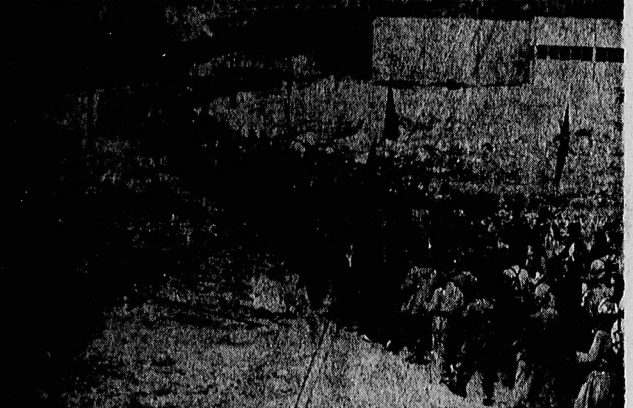
۷۵۰ نفر از عشایر فریب خورده به میهن اسلامی بازگشتند

پژ ۱۴ تن از صامیان کافر در جبهه دلاوه به هلاکت رسیدند