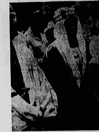
عربستان سعودی چهار هزار شاهزاده دارد که آنان شرکتی بزرگ غربی هستند.

روان حرف می‌زنند. تحصیلاتشان در سطح جهانی است و لایس‌های غربی می‌شوند. به وضع سیاسی عربستان و یادآوری افکار عمومی عربستان نسبت به آگسود دیگر ضایع می‌شود. رژیم حاکم سعودی با توجه به آسود نیست‌هایی که بر اثر ناامانگی مردم بین‌رشمسریع قدرت اقتصادی و آموزشی از یک سو و آنگاه کند اختراعات سیاسی مردم از سوی دیگر بوجود آمده است. تهدید می‌گردد. آنچه که این مصلحت‌ناظرانسان ها را پیچیده می‌سازد، بندار و بر هراوج مردم است که شماری از اعضای تبار سلطنتی را هایش، ساند و مکار و همت غربی‌ها می‌بایند.