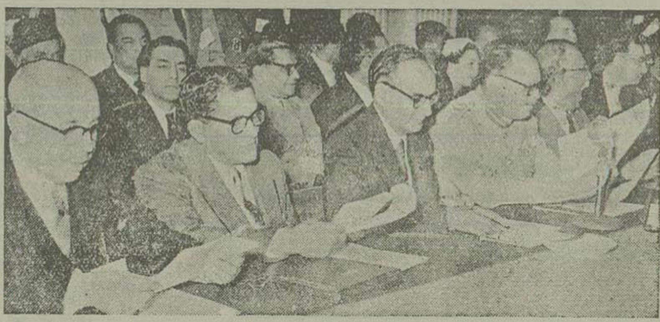
از چپ بر راست آقایان ژنرال رضاشفیر کبیر پاکستان در ایران - حمید الحق چودری وزیر خارجه پاکستان چودری محمد علی نخست وزیر پاکستان و رئیس ستاد ارتش پاکستان، اعضای هیئت نمایندگان پاکستان دیده میشوند

برای خبر نگاران سه ردیف صندلی در قسمت جنوبی تالار چیده بودند و قبل از اینکه هیئتها وارد این تالار بشوند خبر نگاران در صندلیهای خود نشستند. چند دقیقه بعد هیئتها نیز وارد شدند و در مکانهای مخصوص خود که بترتیب از چپ به راست در ردیف میز رئیس شورا و دبیر کل و معاون دبیر کل نشسته. در پشت سر آنها اعضای دبیرخانه قرار گرفتند. در قسمت چپ میز هیئت های نمایندگان ایران و عراق و پاکستان و در سمت راست میز ناظرین امریکائی و هیئت های انگلیسی و ترکیه نشستند. در این میزیز یک خانم انگلیسی مترجم نشسته بود. جلوی هر هیئت یک سینی که چند لیوان و چند شیشه آبملی و سودا در آن گذاشته شده بود دیده میشد. مشاورین سیاسی و اقتصادی و نظامی هیئتها در پشت سر اعضای اصلی هیئت خود نشسته بودند. بقیه در صفحه چهاردهم