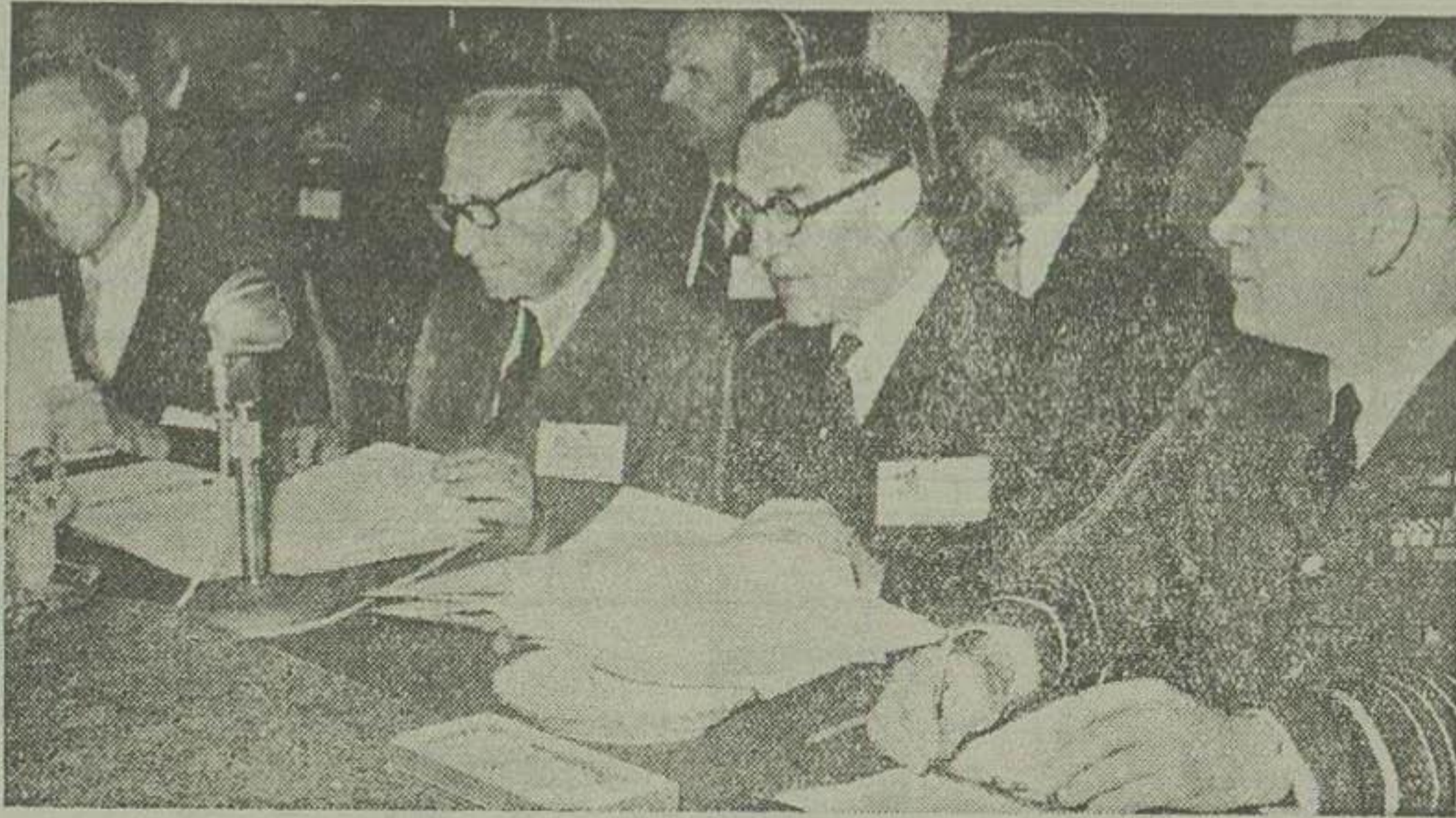
در این عکس اعضای هیئت نمایندگان انگلیس دیده میشوند. از راست بچپ مارشال هوئی و ویلیام دیکسون سرورالتر مونکتون وزیر دفاع انگلیس و رئیس هیئت، سفیر کبیر انگلیس در عراق و سفیر کبیر انگلیس در ایران

جریان تشکیل دومین شورای وزرای پیمان بغداد را در شماره دیروز بطور خلاصه باستحضار خوانندگان محترم رساندیم و اینک مبادرت بدرج جریان کامل آن منما میسازیم. اجتماع خبر نگاران از ساعت دو بعد از ظهر بتدریج خبر نگاران و فیلم بردارن و عکاسان داخلی و خارجی در اتاق مخصوص خبر نگاران حضور