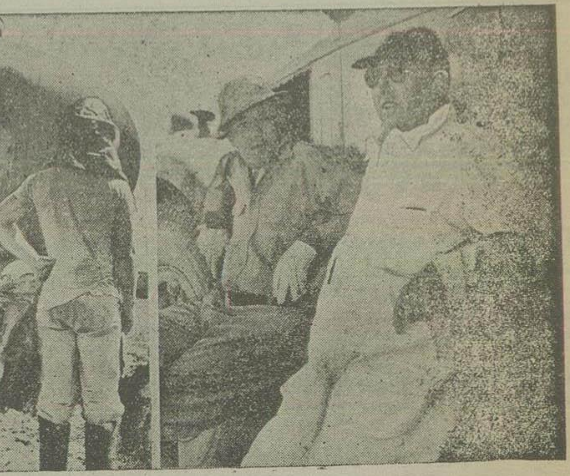
دو عکس در موقع استراحت کینلی کارشناس امریکا و زیرسایه یک تاکسیرکشنک که نفت جمع شده در حوضچه ها را حمل میکند استراحت کرده است

پلوریکه خبرنگار ما از قم اطلاع داد امروز هفت کینلی کارشناس امریکایی صرف برداشتن سکوی زبرد کل نفت گردید و کارگران تحت نظر او به باز کردن بیجاها سکوی برداختند. این کار فوق العاده دشوار بود و علت جمع شدن گاز نفت در زیر سکوی زبرد و فروریختن نفت کارگران نمیتوانستند مدت زیادی بکار بردند و مجبور بودند فاصله های کم جای خود را بدهند. دیگر بیجاها در این مقام مطلع اظهار داشت پس از انجام این قسمت و برداشتن سکوی روی چاه عملیات نصب شیر لایته در راه چاه آغاز خواهد شد. این شیر اکنون در نزدیک چاه آماده شده است.