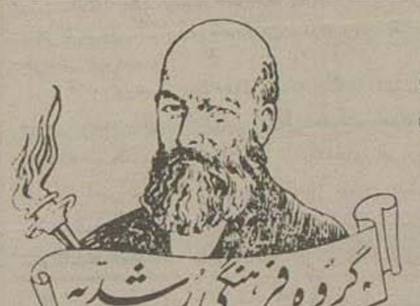
گروه فرهنگی رشیدی

برای سال پنجم طبیعی دانش کتافه و فنی و چاپخانه دانش (آکسپلوشن بهارستان) ۱۷۵۲۲-۱