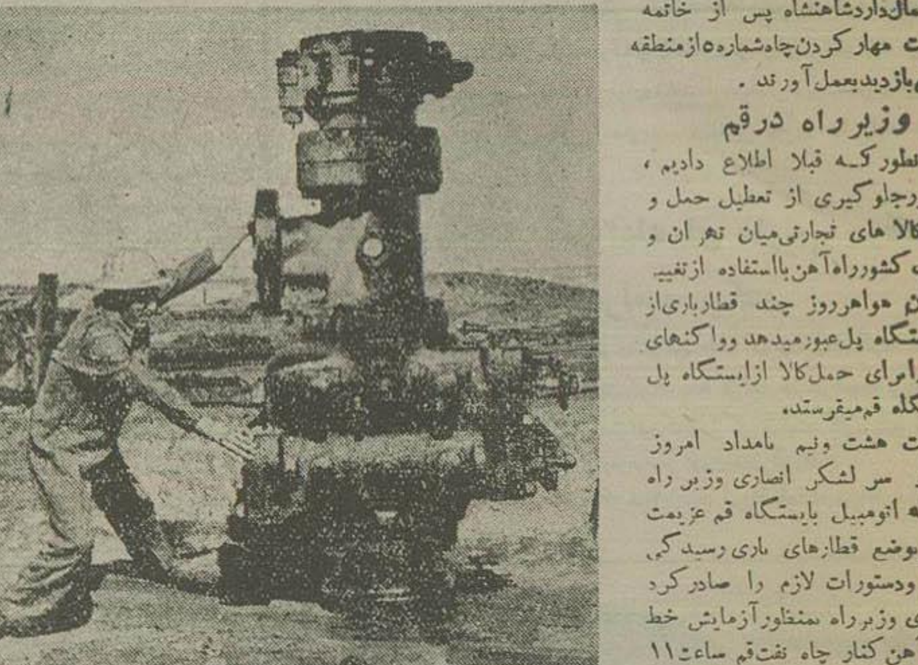
در این عکس شیر مخصوصی که برای گذاشتن روی چاه شماره پنج نفت قم تهیه شده دیده میشود. این شیر هفت تن وزن دارد و دارای شیر های فرعی و دریچه های اطمینان است

احتمال دارد شاهنشاه پس از خاتمه عملیات مهار کردن چاه شماره ۱۵۰ نفت قم بازدید بعمل آوردند. وزیر راه در قم به قلاب اطلاع دادیم، بمنظور جلوگیری از تعطیل حمل و نقل کالا های تجاری میان تهران و جنوب کشور راه آهن با استفاده از تنبیه جریان موافق چند قطار بار از قم بایستگاه پل عبور میدهد و واگنهای خالی برای حمل کالا از ایستگاه پل بایستگاه قم میفرستند. ساعت هشت و نیم امامد امروز تیمسار سر لشکر انصاری وزیر راه بوسیله اتومبیل بایستگاه قم عزیمت نمود و در حوضچه قطارهای باری رسیدگی کرد و دستورات لازم را صادر کرد. آقای وزیر راه منظور از آرایش خط راه آهن کنار چاه نفت قم ساعت ۱۱ امروز بوسیله یک درزین که شخصاً آن را هدایت میکرد از ایستگاه پل به قم عزیمت کرد.