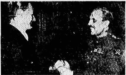
آرمانها و غیر وابسته که سرنگون شد، چه بسا که از اسباب برژینسکی که هست.

بلکه با انقلاب شد امپریالیستی در آن سهم از دستهای داشته اند، و خلف ما، که مسلمانان انقلابی تهران و آشکار به مقابله می بردند.