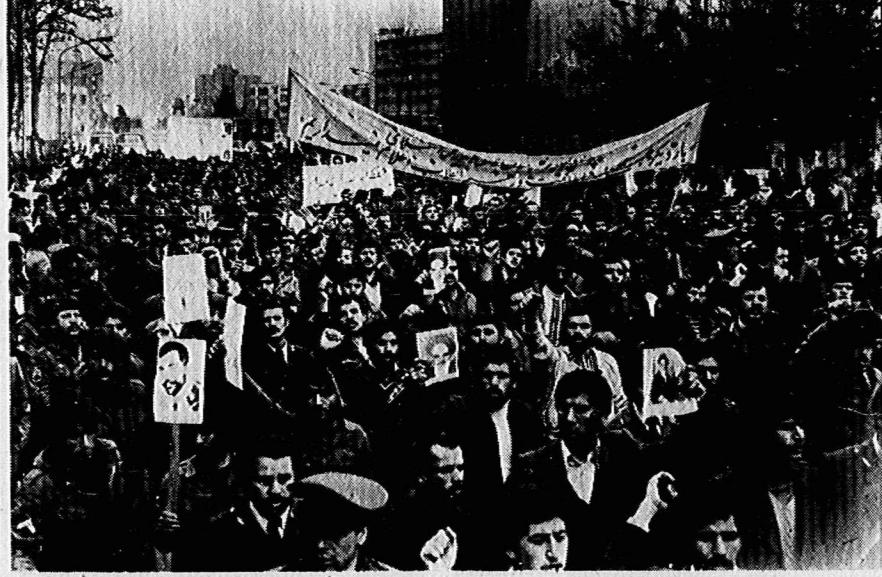
درجه داران نیروی هوایی و کلاه سبزه ها هنگام راه پیمایی

درجه داران نیروی هوایی و کلاه سبزه: مردم بیهوش باشید، مردم بگوش باشید فرماندهان سابق هنوز راس کارند!