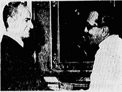
ژنرال ضیاء الحق و غیر وابسته بر گزار کننده کنفرانس آمریکایی پاکستان در خدمت آرمانها و غیر وابسته! یکشنبه ۱۹ شهریور ۱۳۵۷. دوازدهم بعد از گفتار ۱۷ شهریور پیمان خیانت برداری خون شهدا، آماجای ایران انقلابی در کنار ژنرال است!