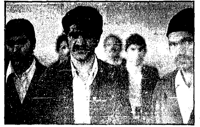
۳ روستائی که به حبس ابد محکوم شدند

تظلمی به دادسرای قزوین فرستادند. پرونده از دادسرای قزوین به تهران ارجاع شد و در اینجا جهت رسیدگی در اختیار شعبه پنجم دادگاه عالی جنائی قرار گرفت. این دادگاه که ریاست آن بسمه وجهانگیر حسنجانی بود، ۴ روز به این پرونده رسیدگی کرد و هر ۳ نفر را به ارتقای آن به حبس دائم محکوم کرد. این ۳ هم چنین از نظر مرتکب نیز هر یک به ۲ سال زندان محکوم شدند. متهمین به رای صادره اعتراض نکردند و فرجام خواستند.