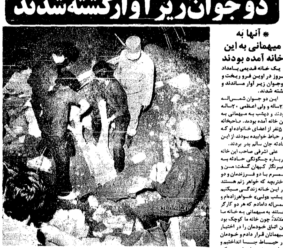
مأموران سرگرم بیرون آوردن اجساد از زیر خاک هستند

ارور در ایستگاه «نیه» اوین کسوجه حمام رسانند، امدادگران عملیات خود را برای بیرون آوردن این دو جوان آغاز کردند. مأموران پس از چند ساعت تلاش که تا ۳/۵ ساعت طول کشید، جسد و لسی و شمشه را از زیر خاک و آجر بیرون آوردند. علت ریزش این ساختمان هنوز معلوم نشده است و تحقیق در این باره ادامه دارد.