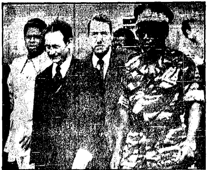
موبوتو و رئیس‌جمهوری زیم در حال ورود به فرودگاه پاریس. موبوتو پرواز وارد فرانسه شد تا درباره شورش ایالت شیا در کشور خود، به کنفرانس سیران کشورهای افریقایی زبان در پاریس گزارش دهد.

سازمان سدر در لبنان یک گروه مذهبی مسیحی است که در سال ۱۹۷۵ تأسیس شد. این گروه در ابتدا به عنوان یک سازمان دفاعی برای محافظت از مناطق مسیحی در لبنان تأسیس شد، اما به تدریج به یک گروه نظامی قدرتمند تبدیل شد. این گروه در جریان جنگ داخلی لبنان نقش مهمی ایفا کرد و در سال ۱۹۹۰ به یک دولت موازی در جنوب لبنان تبدیل شد. این دولت موازی تا سال ۱۹۹۵ به عنوان یک دولت مستقل در جنوب لبنان شناخته می‌شد، اما در نهایت به یک گروه نظامی در لبنان تبدیل شد.