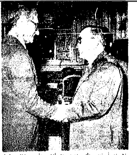
سازمان اطلاعاتی طبر در روزهای آغازین ریاست جمهوری دو کابینه جای کرده را در کاخ نیاوران حضور پذیرفتند (برخ در صفحه ۱۱ قبل آخر ستون مناسبت سیاسی روز)