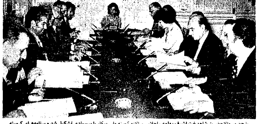
با حضور والا حضرت شاهدخت اشرف پهلوی، اجلاس سالانه کمیته ملی پیکار بایسوادی تشکیل شد و برنامه‌های کمیته مورد بحث و بررسی قرار گرفت

تهران - خبرگزاری پارس - در حضور والا حضرت شاهدخت اشرف پهلوی نایب ریاست عالی کمیته ملی پیکار جهانی با بیسوادی اجلاس سالانه این کمیته در کاخ سعدآباد تشکیل شد. در این جلسه، غلامرضا افندی دبیر کل کمیته پیکار جهانی با بیسوادی گزارشی باستانوار رساند و برنامهمهای سال جاری مورد بحث و بررسی قرار گرفت و ترانزنامه سال گذشته تصویب رسید. وی در مورد طرح جهادسوادآموزی گفت: طرح جهاد، مسأله سوادآموزی بصورت یک فعالیت که در جایی که این گروه ضمن مطالعه