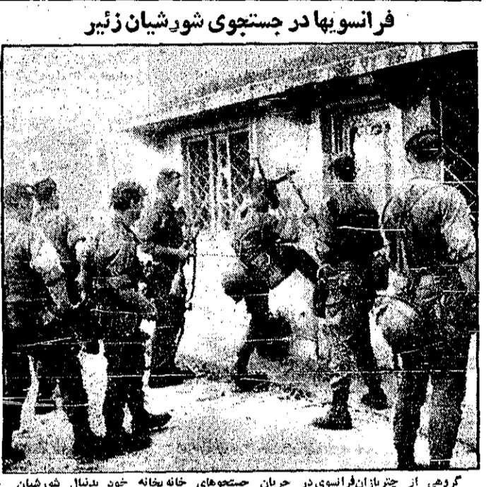
گروهی از چترپازان فرانسوی در جریان مسابقات جهانی خانه بخت خود بدنبال شورشیان در شهر کولوزی در حال ورود به خانه های دیده می شود. در حدود ۸۰۰ سرباز از یون خارجی فرانسه برای حفظ نظم در شهر کولوزی گشت می دهند. (رادیو فرانسوی آوشیتین پارس)

درکیشان امروز جدول کامل پخش مسابقات جام جهانی فوتبال از تلویزیون صفحه ۲۵ - ستون پنجم