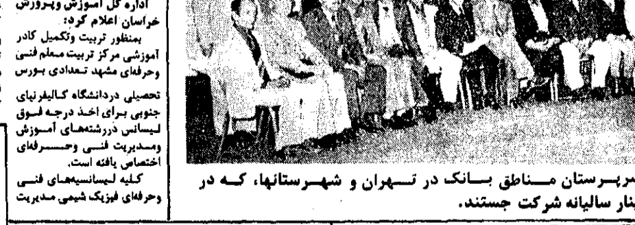
عسکری گروهبی، از مدیران بانک عمران و سرپرستان مناطق بانک در تهران و شهرستانها، که در سمینار سالیانه شرکت جستند.

فعالیت‌های گذشته و برنامه‌های آینده بانک عمران مورد بررسی قرار گرفت اصفهان - خیبرنگار - کیهان: در روز دوازدهم خردادماه جلسه‌ای در بانک عمران برگزار شد تا فعالیت‌های گذشته و برنامه‌های آینده این بانک مورد بررسی قرار گیرد.