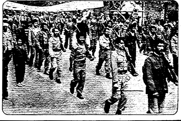
کارگران کمیوت سازی های خراسان (مشهد):