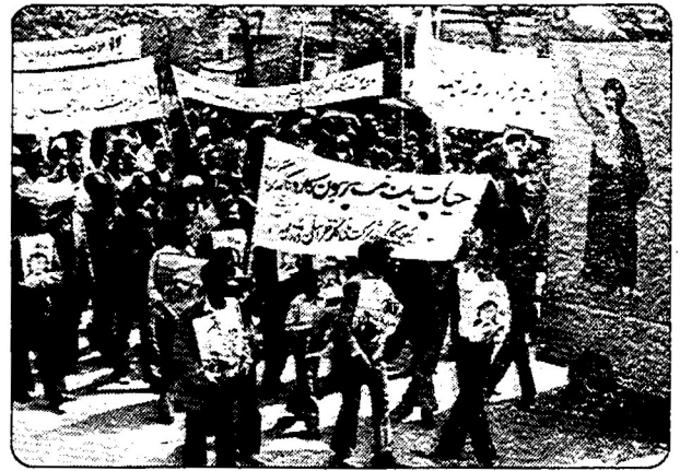
یازدهم اردیبهشت اسام، در مشهد راهپیمائی باشکوهی توسط کارگران و زحمتکشان و اقشار مختلف مردم، به مناسبت فرارسیدن اول ماه مه، برگزار گردید. یلاکاردهائی به امضاء شوراهای اسلامی کارخانه ها، شرکتها و مراکز تولیدی زبردیده مشهد: شرکت تیم، کارخانه سیم، نخ - رسی، شرکت ملی گاز خراسان و مازندران، قدس رضوی، راه آهن، بوسان، ایرفرش، سندیکای صنایع غذایی، سندیکای راه ساختمان، شرکت زرم، شرکت آجر، ماشین مهبسغ و چین چین، برق منطقه و ...