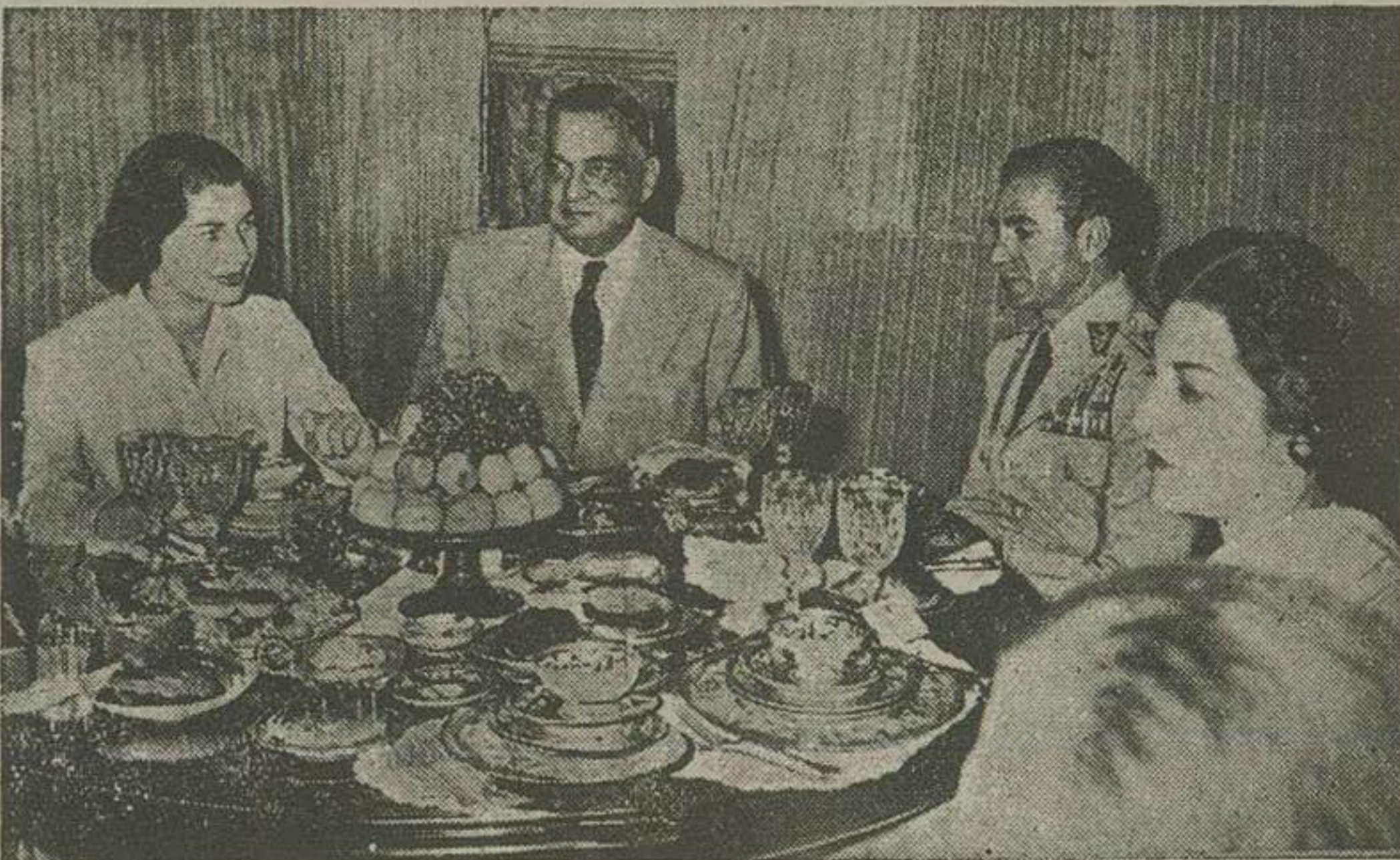
شاهنشاه و علیحضرت ملکه و حضرت نزار اسکندر میرزا و بانو در سر میز صبحانه

ساعت هفت و ربع صبح امروز نزار اسکندر میرزا رئیس جمهوری پاکستان با ناهید خانم امیر تیمور همسر خود ۲۰ دقیقه در صحنه چهارم