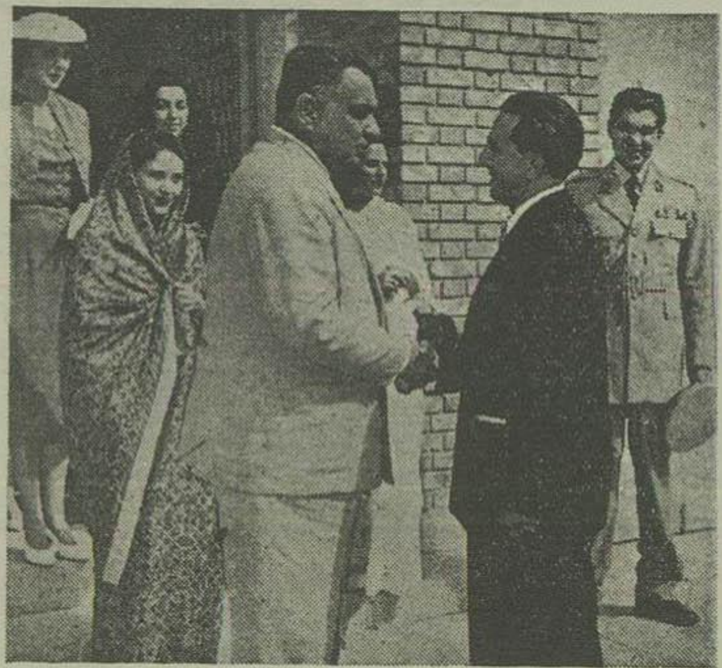
رئیس جمهور پاکستان آقای امیر تیمور کلالی پدر خانم خود خداحافظی میکند

عده‌ای از آجودانهای ژنرال اسکندر میرزا نیز همراه ایشان بودند که از آنها در آشنایی سلطنتی فرودگاه مهرآباد پذیرائی بعمل آمد و صبحانه صرف کردند. رئیس جمهور پاکستان مدت باقی روزهای مانده در این کشور، در این سفر، در پاکستان مدتی اقامت خواهد نمود. احتمال می‌رود در این سفر، خانم میرزا نیز همراه ایشان باشد. زسرًا هماترور که اظهار داشتند ایشان احتمال قوی