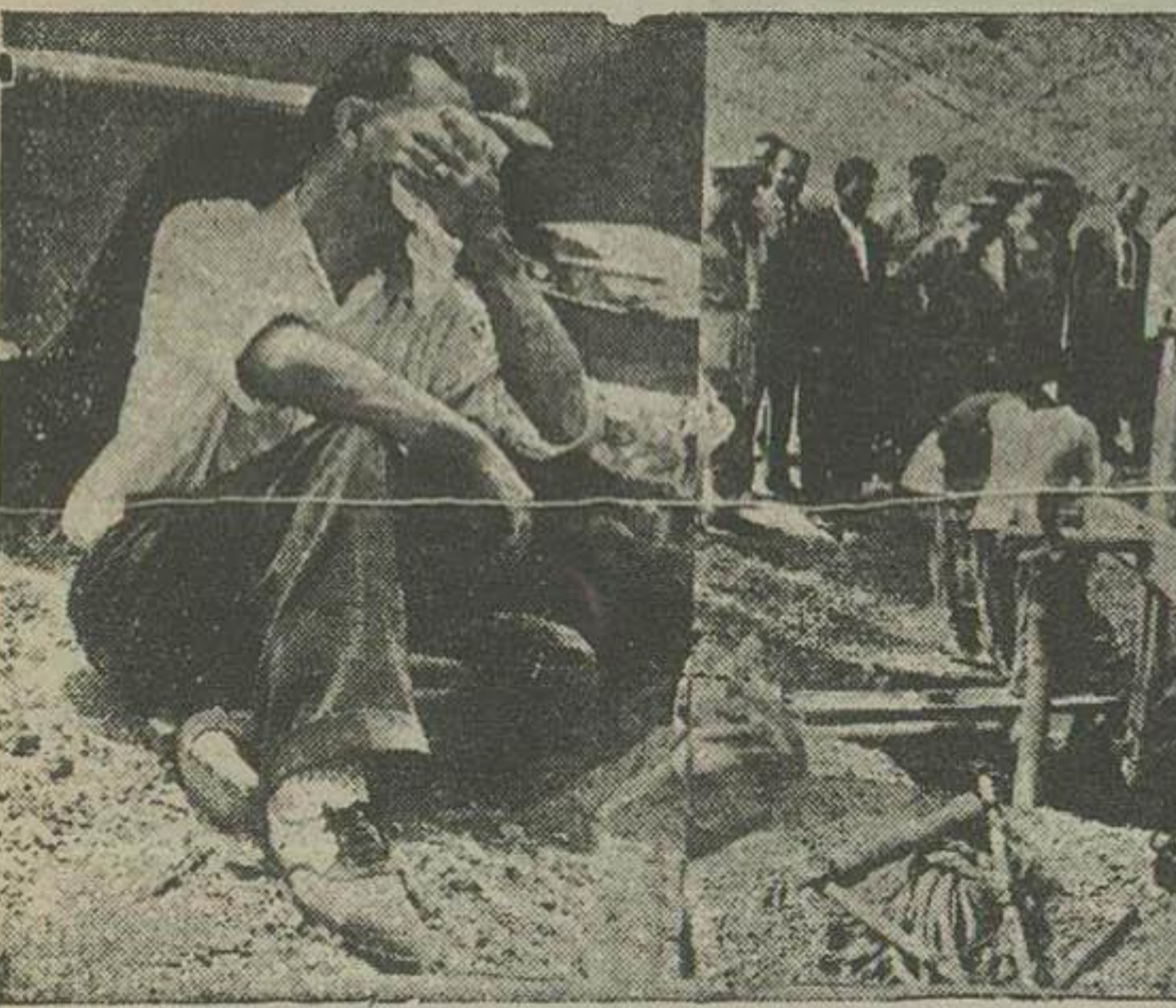
موقعبه مقتیها مشغول کردن چاه بودند برادر و کسان غفاری مقتول شیون می کردند

کارمندانی که در ساعت مقر در اداره حاضر نباشند مورد مواخذه قرار میگیرند امروز آقای فروغ روزبهی دارائی میزبان کل آتوزارخانه دستورداد همه روز عده ای از میزبانان آن اداره با دارات تابع وزارت دارائی اعزام شوند تا در اول آخروقت و همچنین در واسط ساعات اداری کلیه طایفه های ادارات را س کشنده نموده اسامی کاتبی که سبب تأخیر در تر از ساعت مقر سر خدمت حاضر و باز در تر از پایان ساعت کار بدون اجازه کتبی و عذر موجه آداره را ترک نموده اند تعمیریک نسخه آنرا مستقیماً اداره کل کارگزینی ارسال دارند. اداره کل کارگزینی دستور داده شده است احکام انتظار خدمت این قبیل کارمندان را که برخلاف مقررات رفتار و دیر تر از وقت مقر در اداره حاضر میشوند و یا بدون اجازه کتبی در ساعات اداری میز خود را ترک میکنند تهیه و برای امضاء فرستند.