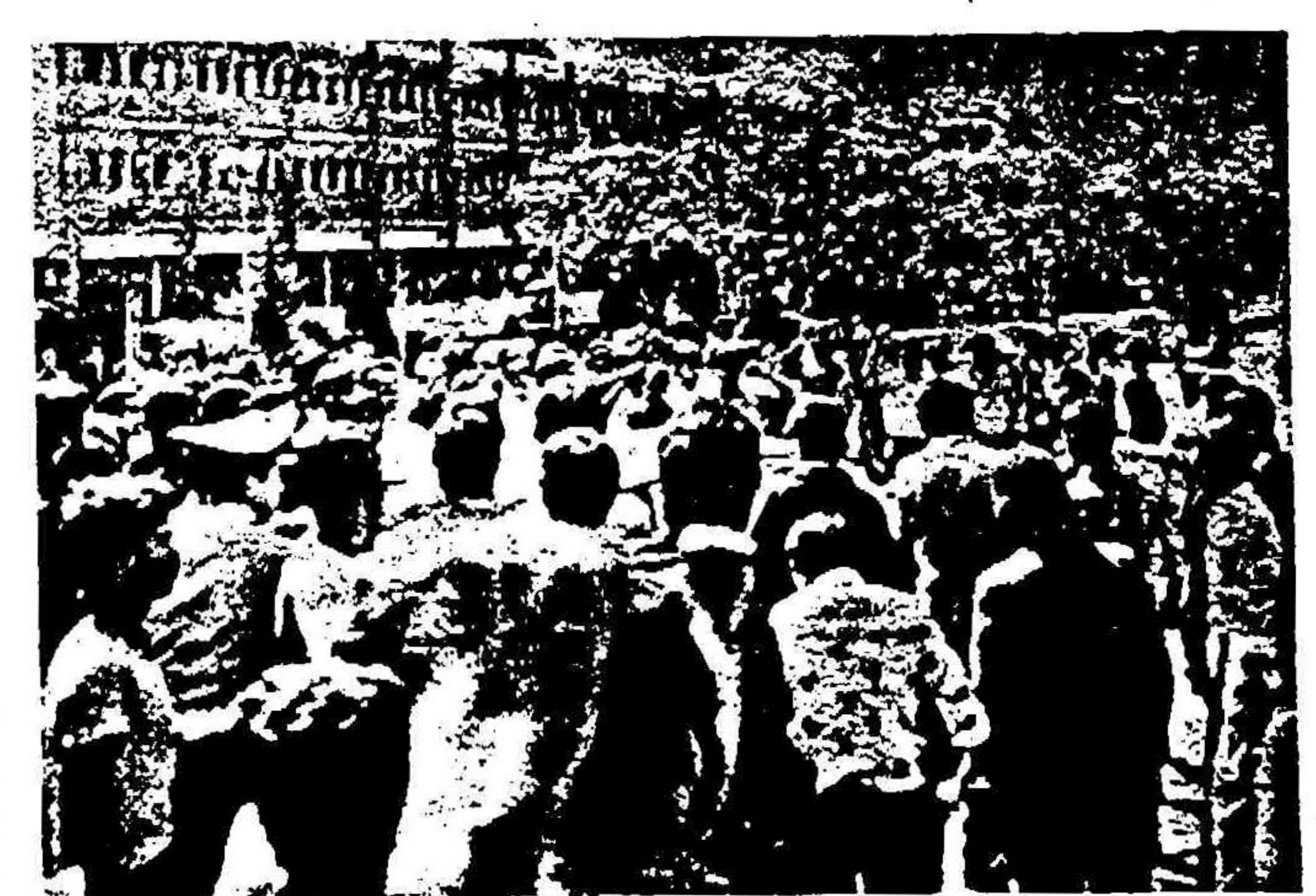
مردم خطاب به ضیاء الحق: مرگ بر آمریکا مرگ بر دیکتاتور

مردم مبارز تهران، ضیاء الحق را از نمایشگاه بین المللی بیرون کردند! حاضرین در نمایشگاه با مشاهده ضیاء الحق فریاد زدند: مرگ بر دیکتاتور، مرگ بر آمریکا!