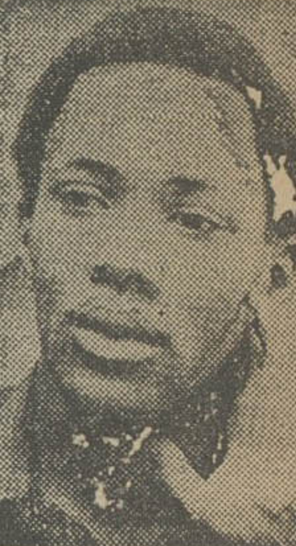
همه قهرمانان واترگیت ثروتمند شده اند :

بجز يك نفر ! تاکنون ۵۲ نفر از کسانی که به نحوی در رسوایی واترگیت نقشی داشته اند ، بزندان رفته اند . «فرانک ویلیس» ، يك سیاه پوست ۲۸ ساله است . پنج سال پیش ، اگر او متوجه دزدی در کنوانسیون ملی حزب دمکرات نمی شد ، امروز نه کسی از ماجرای واترگیت باخبر می شد ، نه آدمی باسم جرالدفورد رئیس جمهور میشد و نه (جیمی کاتر) به کاخ سفید راه مییافت . اغلب دست اندرکاران ماجرای واترگیت ، علیرغم محکومیت های سنگین ، به شهرت و ثروت بیسابقه ای رسیده اند .