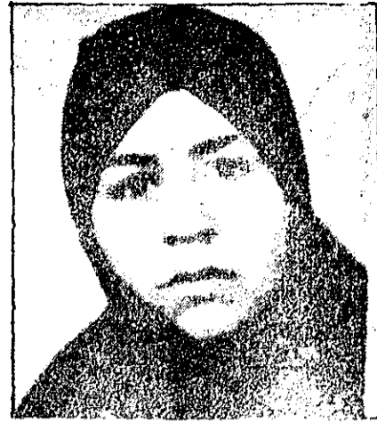
حادثه در بیمارستان راویران رخ داد. زنی که در انفجار کشته شد.

برق نوجوان ۱۴ ساله را کشت نوجوان ۱۴ ساله‌ای دچار برق گرفتگی شد و سپس از انتقال به درمانگاه جان سپرد. این نوجوان در زمان وقوع حادثه در حال بازی با یک توپ فوتبال بود. پدرش در جریان حادثه در حال بازی با توپ فوتبال بود و متوجه شد که نوجوانش برق گرفته است. او بلافاصله نوجوان را از برق جدا کرد و با آمبولانس به بیمارستان منتقل کرد. پزشکان نتوانستند او را نجات دهند و او درگذشت.