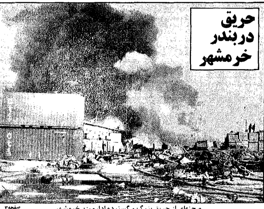
صحنه ای از حریق بزرگ و گسترده اداره بندر خر مشهر

در انجمن شهرستان آبادان گفته شد: آبادان باید تکلیف آتش نشانی خود را روشن کند