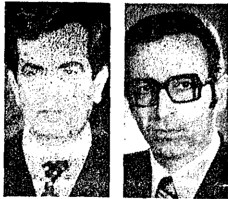
مرتضی صالحی - مشاور و رئیس سازمان برنامه منوچهر آگاه - وزیر مشاور