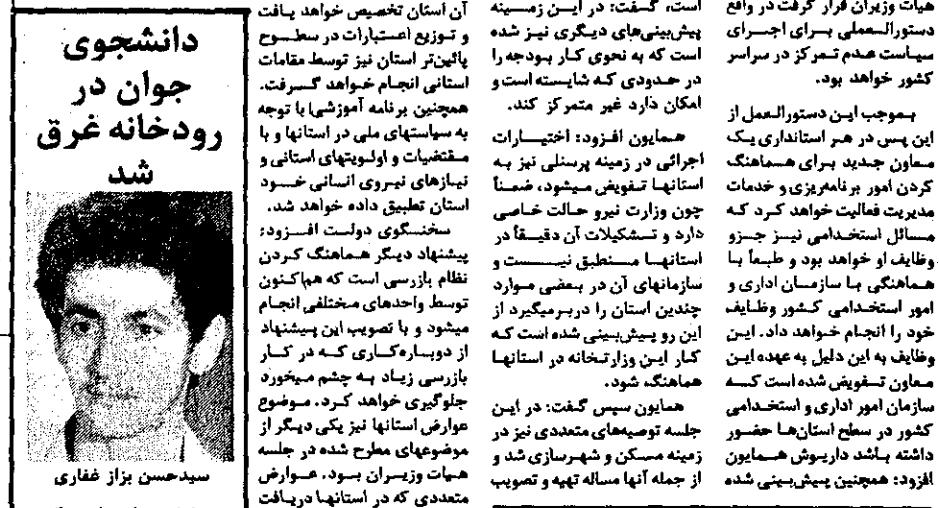
سیدحسین بزاز غرق شد

دزفول- مرگ برادر یکی از دانشجویان دزفول در رودخانه غرق شد. سیدحسین بزاز غرق شد. سیدحسین بزاز غرق شد. سیدحسین بزاز غرق شد.