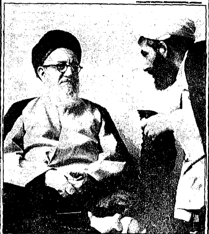
حضرت آیت الله شریعتمداری، مرجع عالیقدر شیعیان خیر نگار مجله آلمانی اسپیکل را در قم به حضور پذیرفتند و به سئوالات او پاسخ دادند و این مصاحبه در شماره ۲۱ (مطابق با ۳۰ مرداد) گذشته این مجله به چاپ رسید.

* من نمی خواهم قهرمان شوم، همین قدر میدانم که صحبت های من بایمان من و وجدان من از یک ریشه آب میخورد