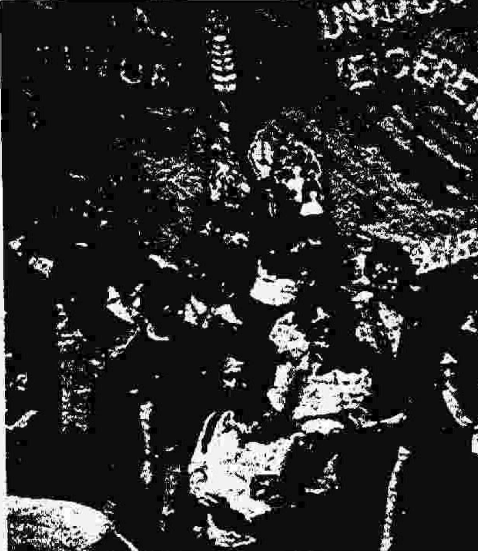
تظاهرات اتحادیه های کارگری در لیسن: مبارزه ادامه دارد!

حزب کمونیست پرتغال مردم را از این اشتباه برحذر میدارد که گویا نتایج انتخابات ریاست جمهوری بخودی خود معمول آیند. پرتغال را همین خواهد کرد و خاظر نشان می سازد که بیکار تودمایی مهم ترین شکل مبارزه باقی خواهد ماند.