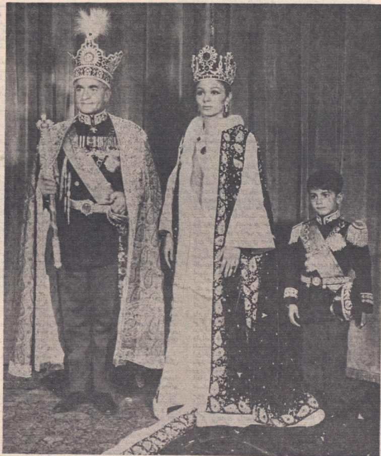
چهارم آبان ماه ۱۳۴۶ - مراسم تاجگذاری شاهنشاه آریامهر و علیاحضرت شهبانوی ایران در کاخ گلستان انجام شد و باین مناسبت، صدها طرح مختلف عمرانی و آبادانی در چهار چوب انقلاب در سراسر کشور مرحله بهره‌برداری رسید.