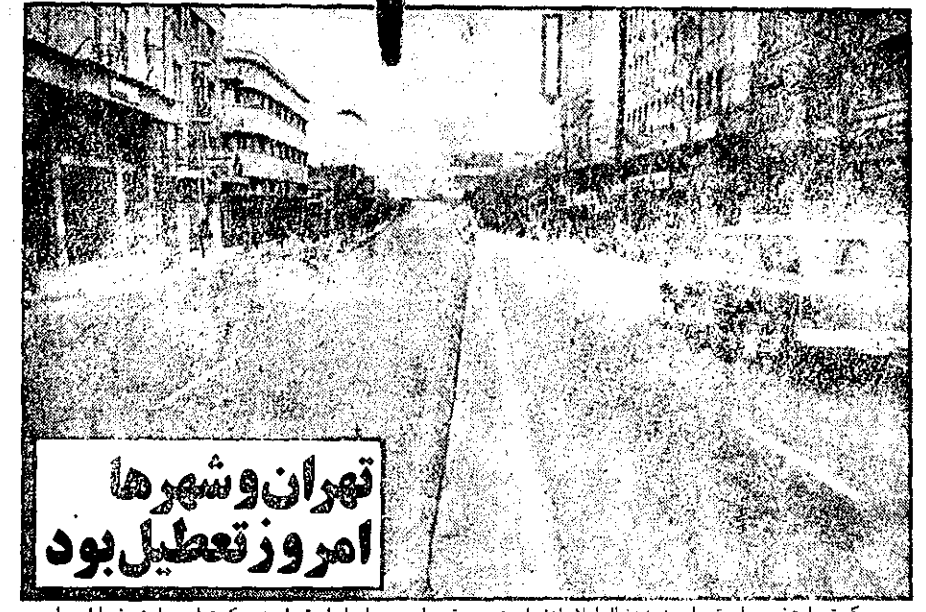
تهران و شهرها امروز تعطیل بود

سکوت ماحضور ماست - امروز به دنبال اعلام اعتصاب عمومی توسط جبهه ملی ایران تهران در سکوت فرو رفت. خیابانها خلوت شدند و تعداد وسایل نقلیه به حداقل کاهش یافت. عکس خیابان سعدی را در ساعت ۱۰ بعد از ظهر می‌دهد. گزارشهای رسیده حاکیست شهرهای کشور نیز امروز به حال تعطیل درآمده بودند