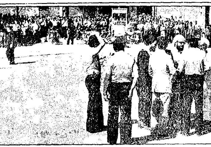
جمعی از روحانیون ضمن مذاکره با مأموران انتظامی از آنها می‌خواهند که اجازه بدهند مردم به آرامی به خانه‌هایشان بروند.

وارد هسبراتی شود، در ۱۵ کیلومتری بصره، بندر مهم عراق، دستگیر شد. منجم هاشم عبدالعزیز نام دارد. وی اعتراف کرده است که یکی از کسانی است که در آتش‌سوزی سیمنا رگس دست داشته است. خبرگزاری عراق گزارش داد پلیس عراق یک ایرانی را که به شرکت در فاجعه آتش‌سوزی سیمنا رگس متهم کرده است. این خبرگزاری گزارش داد که مرد ایرانی چهار روز قبل متناگبه قصد داشت غیرقانونی