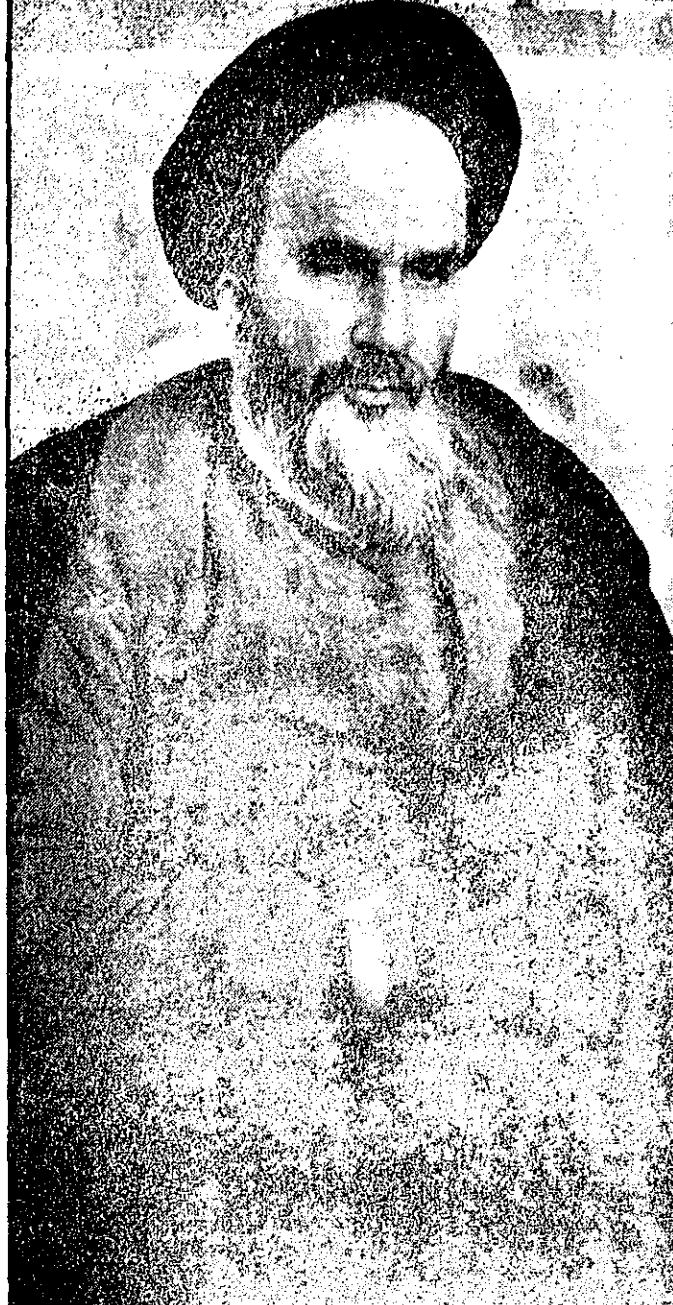
حضرت آیت الله العظمی آقای روح الله موسوی خمینی