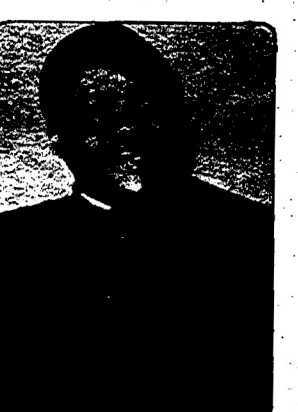
ماتیو کرکو، رئیس جمهور بنین

پوپلر دو بنین) پایه گذاری و کشور به "جمهوری خلق بنین" موسوم شد. حزب انقلابی خلق بنین تدوین نخستین برنامه سه ساله توسعه را برای سال های ۱۳۵۹ - ۱۳۵۷ (۱۹۸۵ - ۱۹۷۸) به دست گرفت. آغاز دگرگون سازی های بنیادی اجتماعی - اقتصادی یکی از مهم ترین وظایف این برنامه را تشکیل می داد. بر پایه این برنامه، انقلاب کشاورزی به منظور