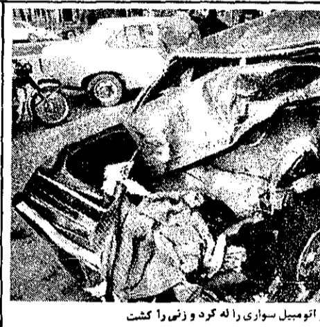
تانکر گاز اتومبیل سواری را له کرد و زنها را کشت

جسد دختر بچه ۶ ساله ای که بر اثر خودکشی مغزی جان سپرده است، در انتهای خیابان ششم نیروی هوایی پیدا شد. سامورین کلانتری تهران نو دیروز هنگامیکه سرگرم گشت بودند با جسد این دختر بچه که سر و صورتش خون آلود بود، روبرو شدند. و با مشاهده جسد سراسر را به پادسرای تهران اطلاع دادند. جسد دختر بچه از سوی سامورین کلانتری تهران نو به مرکز پزشکی قانونی انتقال یافت و دکتر کرمان رئیس تالار تشريح مرکز پزشکی قانونی پس از معاینه از جسد علت مرگ را شکستگی جمجمه ذکر کرد. سامورین کلانتری تهران نو هم اکنون سرگرم تحقیق در این زمینه هستند. و کوشش برای شناسایی کسان و نزدیکان این دختر بچه ادامه دارد.