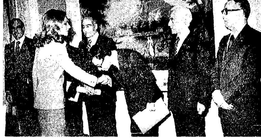
در پیشگاه علیاحضرت شهپانو، جلسه هیات استانی بنیاد فرهنگ ایران تشکیل شد. علیاحضرت در این جلسه، اوامری در مورد انتشار متون مهم تاریخی صادر فرمودند.

پیشگاه علیاحضرت شهپانو، جلسه هیات استانی بنیاد فرهنگ ایران تشکیل شد. علیاحضرت در این جلسه، اوامری در مورد انتشار متون مهم تاریخی صادر فرمودند. اوامری در مورد برپائی سمینارهای آموزشی و بازآموزی معلمان، گزارش فعالیت‌های هیات استانی، انتشاراتی و نیز برنامه‌های آموزشی و طرح‌های پژوهش درباره زبان فارسی و اشاعه زبان فارسی در ممالک خارج را بر عرض رساند.