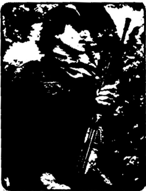
خلق السالوادور مسلحانه بر ضد سلطه امپریالیسم آمریکا و رژیم دست نشانده اش پیکار میکند

نفر قربانی این "پاکسازی" ها شدند. بگفته می شود، ۴۴۰۰ تن دیگر بر اثر بمباران های نیروی هوایی مهلاکت رسیده اند. هنگامی که "خونتا" بی السالوادور به نیروی سیاسی و نظامی فزاینده "جبهه آزادی ملی فارابوندو پارتی" و "جبهه دمکراتیک انقلابی" بی بود، به توصیه اربابان امپریالیستی خود، راکارانه خواستار "گنگو" شد.