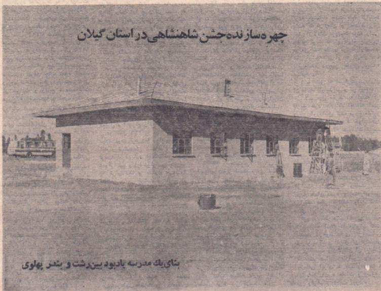
بنای یک مدرسه یادبود بینرشت و بندر بهلوی

رپرتاژ مصاحبه مادر صفحه هشتم چاپ شده است