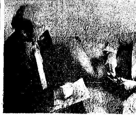
آقای هولمز رئیس کمیته اینگر سولراند در دیدار با مسئولین این شرکت در تهران

مدیر بین المللی شرکت اینگر سولراند برای بازدید از اینگر سولراند ایران وارد تهران شد.