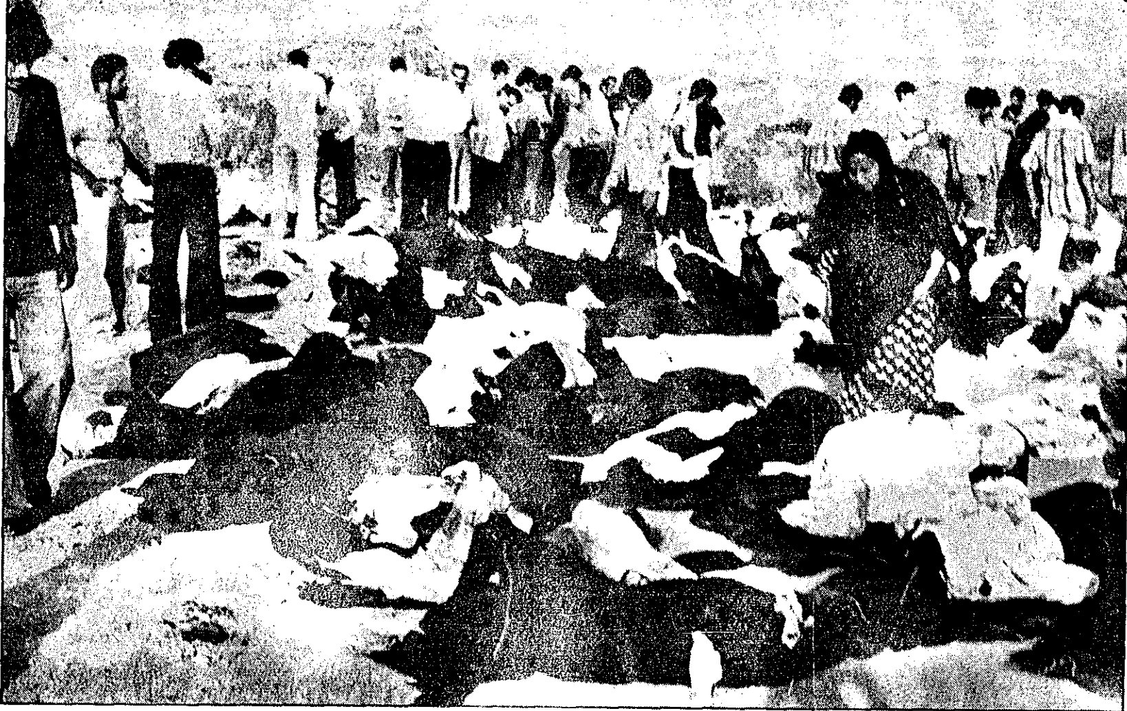
اسامی و عکسهای مقتولان و مجروحان فاجعه آبادان