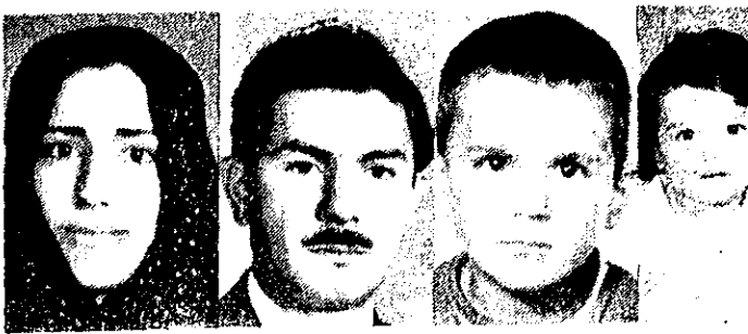
این ۵ نفر اعضای یک خانواده هستند که در انفجار کپسول گاز کشته شدند

* این حادثه چندی قبل روی داد و دادیار دادرسی تهران مسئول بخش گاز را زندانی کرد