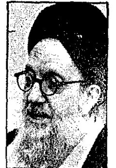
درباره فاجعه آبادان: حضرت آیت اله شریعتمداری اطلاعیه میدهند

نجات یافتگان: در آخرین لحظه در سینما را شکستیم، اما مردم گیج و وحشت زده دیگر قدرت فرار نداشتند در آبادان ۸۰ درصد مراجعان دیروز به مطبها ماتمزدگان هستند