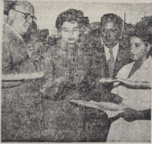
باقطع نواز سرنگ از طرف علیاحضرت ملکه ثریا پهنوی بیمارستان شماره ۲ مسلولین افتتاح گردید آقایان دکتر صالح وزیر بهداشت و آیتین مدیر عامل جمعیت حمایت مسلولین نیز در این عکس دیده می شوند

بطوریکه در شماره گذشته اطلاع دادیم ساعت چهار و نیم بعد از ظهر روز پنجشنبه بیمارستان شماره ۲ جمعیت حمایت مسلولین در محل بیمارستان پهنوی از طرف علیاحضرت ملکه ثریا پهنوی افتتاح گردید. علیاحضرت ملکه ساعت پنج بعد از ظهر با اتوموبیل سلطنتی بسمت بیمارستان تشریف فرم شدند. در این موقع کاد سلطنتی مراتب احترام را بجا آورد و آقای علاء وزیر دربار هیئت دولت و مدمومین با حضور علیاحضرت معرفی کردند. آقای دکتر جهانشاه صالح وزیر بهداشتی از طرف کارکنان بیمارستان غیر مستقیم کت و شرفی در اطراف بیماریاری سلم عرض داشت و آقای آیتین بقیه در صفحه چهارم