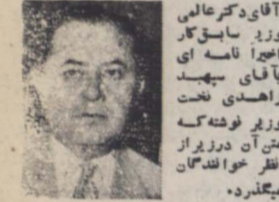
آقای دکتر عالمی وزیر سابق کار

دکتر عالمی وزیر سابق کارگی نامه ای که بنحمت وزیر نوشته خاطر نشان ساخته است که: دکتر مصدق در امور کلی و مسائل مهم کشور با صل مسئولیت مشترک وزیران توچهی نداشت و آنچه در هیئت وزیران مطرح و تصویب میگردد فقط امور عادی بود روز ۲۸ مرداد من جنبش حقیقی توده واقعی ملت را احساس کردم و امیدوار شدم که از خطر رهائی یافته در طریق اصلاح و امن مملکت پیش خواهیم رفت