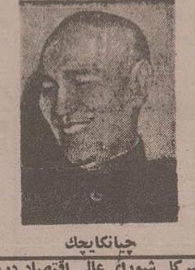
چیانگ کای چک

طرح تملک آبار تمان با استفاده از قوانین سوئد آلمان- ایتالیا و فرانسه تهیه شده است. برای ساختمان دویست خانه چهار صد هزار متر مربع زمین احتیاج است در حالیکه این دویست خانه را میتوان در پنج آبار تمان جا داد