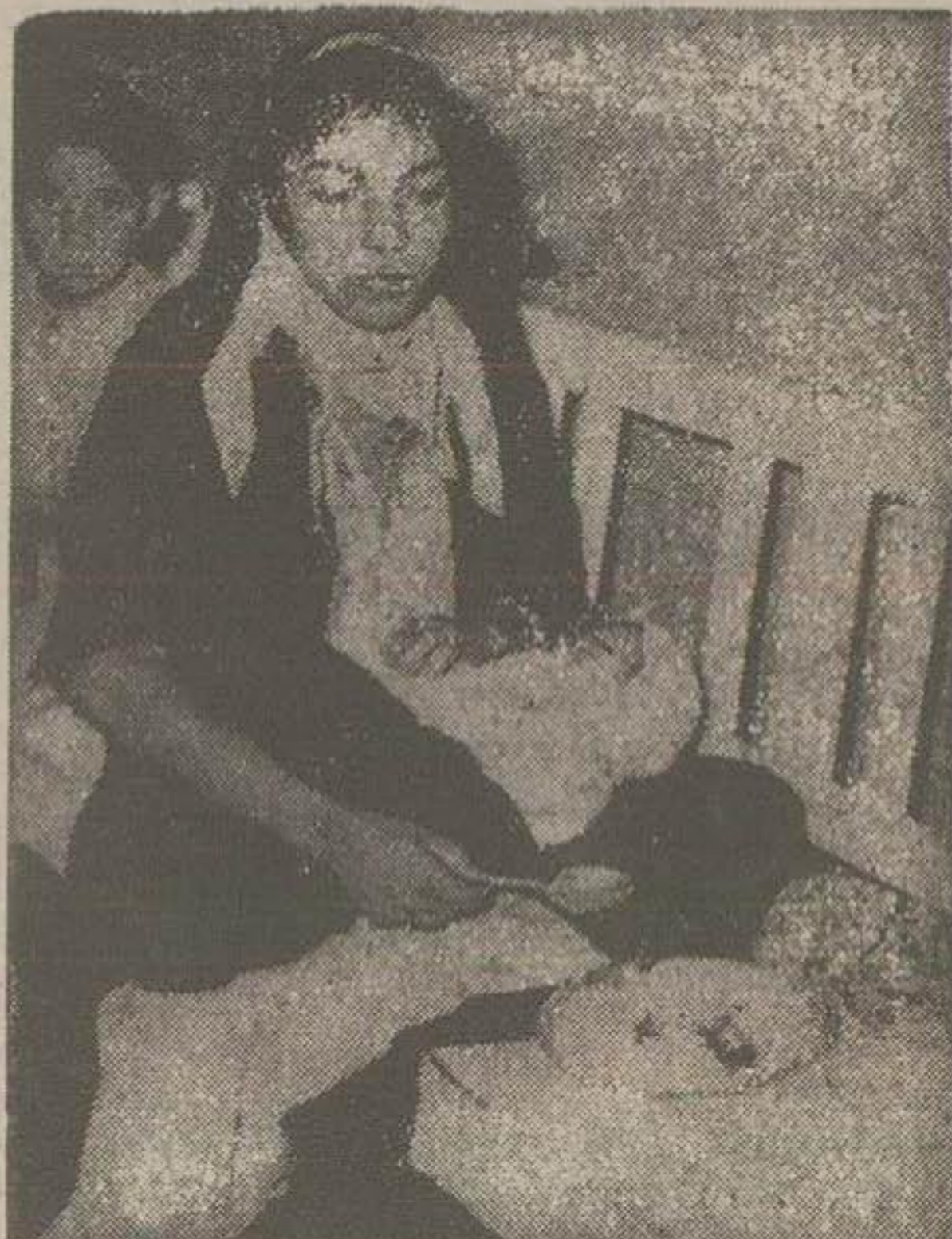
در این گروه مادر جوان باتفاق کودکش حین صرف غذا در دادگستری دیده میشود .

رسیدگی باختلاس یکمیلیون وچهل هزار ریال روز پنجشنبه شعبه سوم دادگاه دیوان کیفر بریاست آقای محمد عریضی رسیدگی خود را بیرونده اختلاس مبلغ یک میلیون وچهل هزار ریال آغاز کرد متهم این پرونده یکی از کارمندان دکانیات مرند است که از لحاظ اهمیت موضوع رسیدگی دادگاه چندین جلسه ادامه خواهد داشت . صدور حکم درباره اراضی مفت آباد هشت سه نفری در جلسه روز پنجشنبه خود که با شرکت آقای غلامرضا فولادوند مدیر کل هیئت ودکنر علی آبادی معاون دادستان کل وعلوی رئیس دادگاه های شهرستان تشکیل شده بود بدادخواست های مربوطه رسیدگی ودر نتیجه تعداد دو بیست و یک حکم در مورد اراضی مفت آباد صادر نموده است .