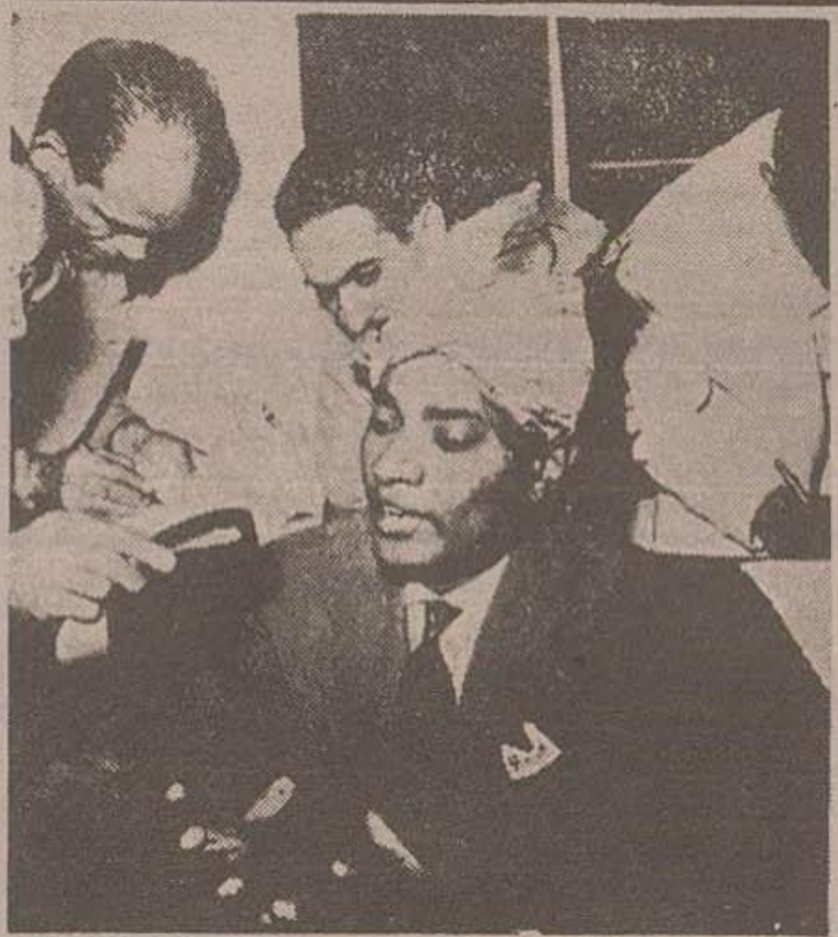
سلطان لاج که چندی قبل از مقام خود خلع شد در قاهره کنفرانس تطبیعی ترتیب داد

در زدو خورد شدیدی که در بعلبک در گرفت ۱۲ نفر کشته شدند شورشیان لبنان با شرکت شارل مالک در مذاکرات مجمع عمومی سازمان ملل متحد مخالفت کردند