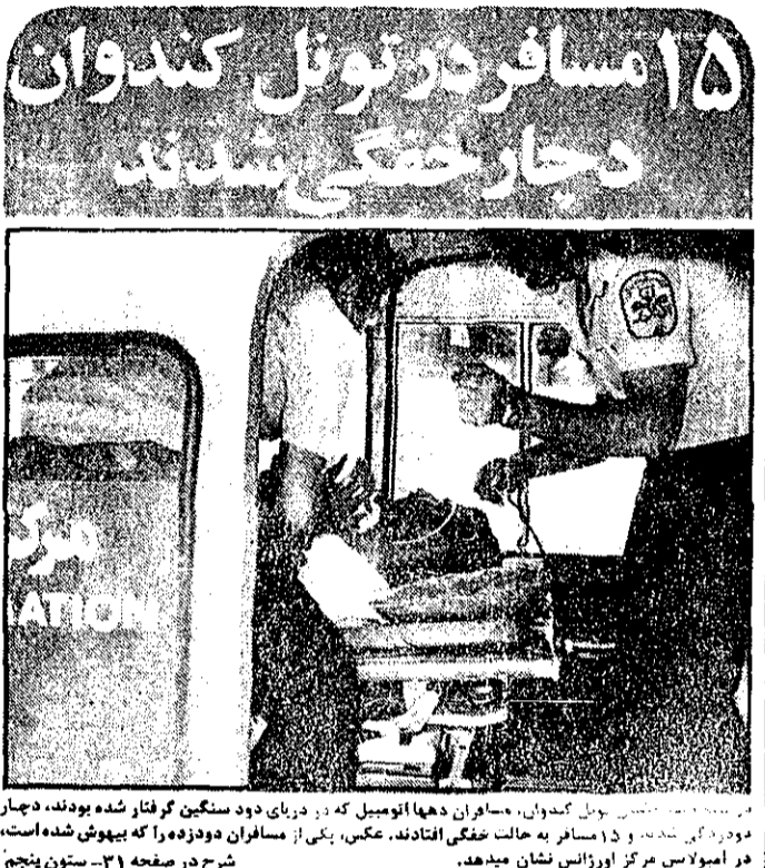
۱۵ مسافر در تونل کندوان دچار حمله وحشی شدند

۲۱ نفر در دریا غرق شدند در دو روز گذشته: