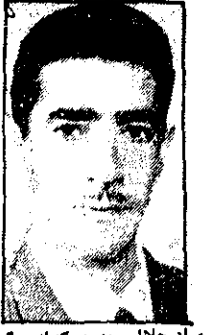
مرد جلالی، پدوی که از مرگ نجات پیدا کرد

* مردی در چاه افتاد و پسرانش برای نجات او بدون چاه رفتند اما جان سپردند