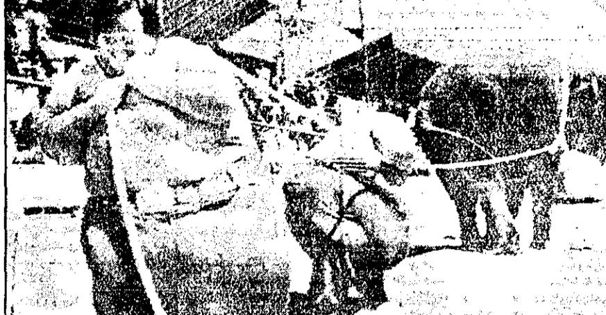
دو برادر دوقلو آمریکایی، که سنگین ترین انسانهای جهان شناخته شده اند، در حال زور آزمایی با فیل ۱۲ ساله ای در یک مزرعه آمریکا دیده میشوند. این دو برادر هر کدام ۳۸۰ کیلوگرم وزن دارند، وزن فیل به ۳ تن میرسد.

لندن - روتتر - پلیس لندن دیروز گزارش داد دزدان مقداری جواهر و پول نقد متعلق به دختر ملک خالد پادشاه عربستان سعودی را به سرقت بردند. سرقت در آپارتمان لوکس در حدود میدان ایلتون صورت گرفت و در نتیجه آن مقداری جواهر و پول نقد به ارزش ۱۵۰ هزار پوند (بیشتر از ۲ میلیون تومان) به سرقت رفت.