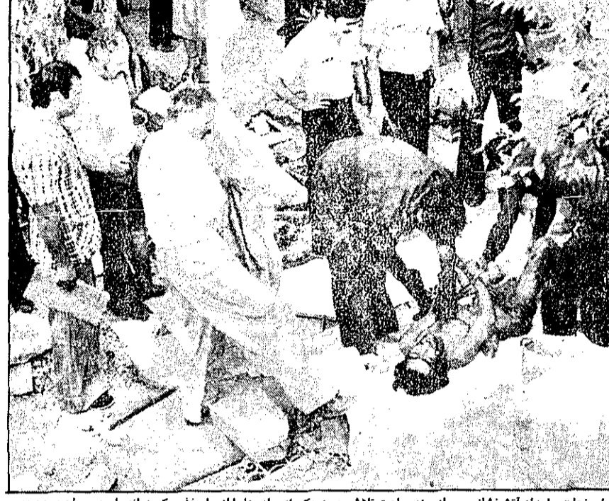
مأموران نجات و امداد آتش‌نشانی پس از چند ساعت تلاش جسد یکی از برادرها را از چاه خارج کرده‌اند. این جوان سه اتفاق برادرش برای نجات جان پدرشان وارد چاه شده بودند که مرد دو خفه شدند