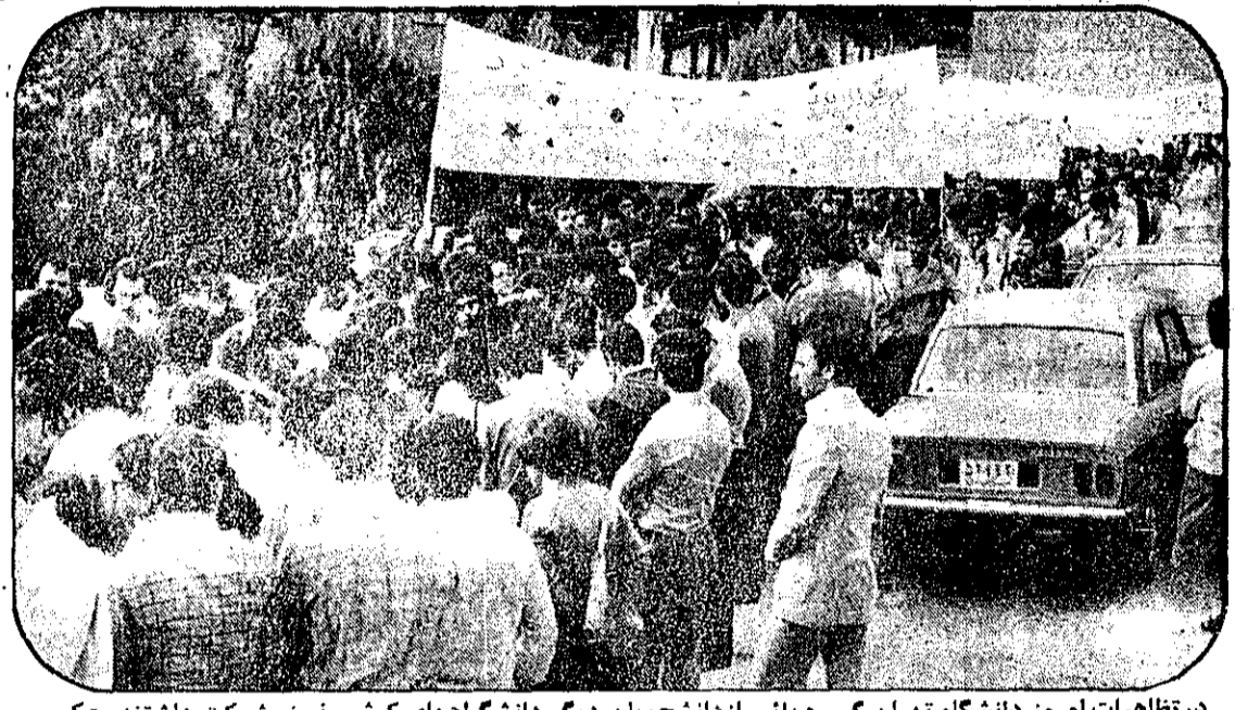
در تظاهرات امروز دانشگاه تهران گروههایی از دانشجویان دیگر دانشگاههای کشور نیز شرکت داشتند. عکس گوشهای از تظاهرات را نشان میدهد.

نخست وزیر: دولت به آزادی عقیده و بیان عقیده راسخ دارد دولت حزب نمیسازد اعلام جرم علیه دادستان سابق تهران