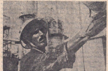
In Abadan, der Stadt der Ölraffinerien