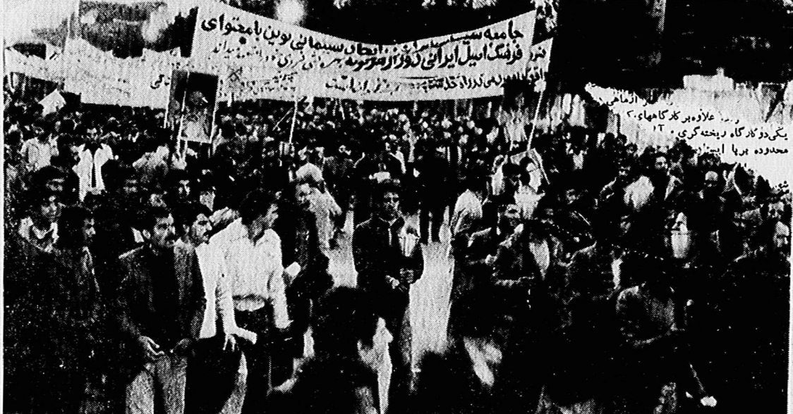
سینماگران، همراه خلق، بر ضد امپریالیسم آمریکا

ضد انقلاب، بکنک پیروزی و لیبرال و چه نهادهای، با سوءاستفاده از جو روانی ناشی از سلطه سالیان دراز خفان و دیکتاتوری که راه بر او کوچکترین اظهار نظر هم یسته بود، و تشنگی مردم برای کسب آزادیها، بلافاصله پس از پایه در صحنه ۲