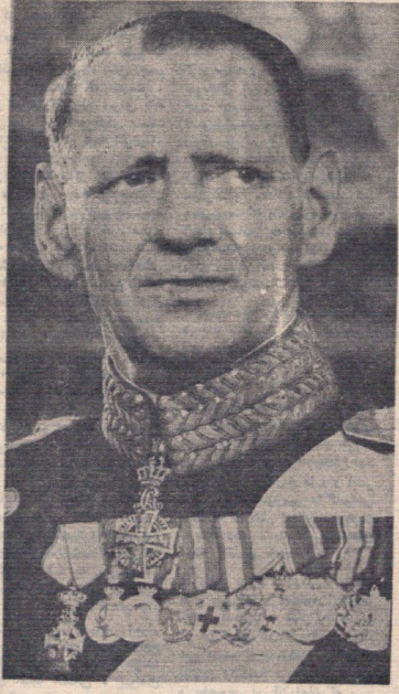
اعلیحضرت فردریک نهم پادشاه دانمارک

آقای ا. دوران سردبیر روزنامه برلیتیک کپنهاگ