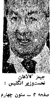
جیمز آتلان نخست‌وزیر انگلیس: صفحه ۳ - ستون چهارم

نخست وزیر انگلیس: ما از گسترش آزادیها در ایران که مورد علاقه شاهنشاه است، و ثبات این کشور حمایت می‌کنیم