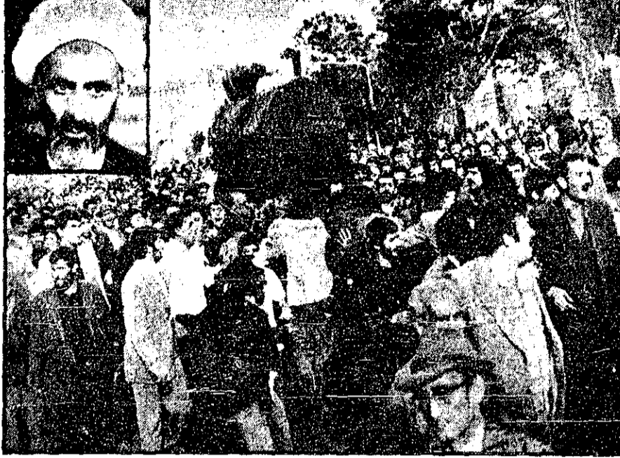
حجرتی از مراسم تشییع جنازه حضرت آیت‌الله غروی در تبریز.

حضرت آیت‌الله العظمی شریعتمداری از درگذشت آیت‌الله غروی تونوچی ابراز تأسف کردند و به فرزندانشان تسلیت گفتند.