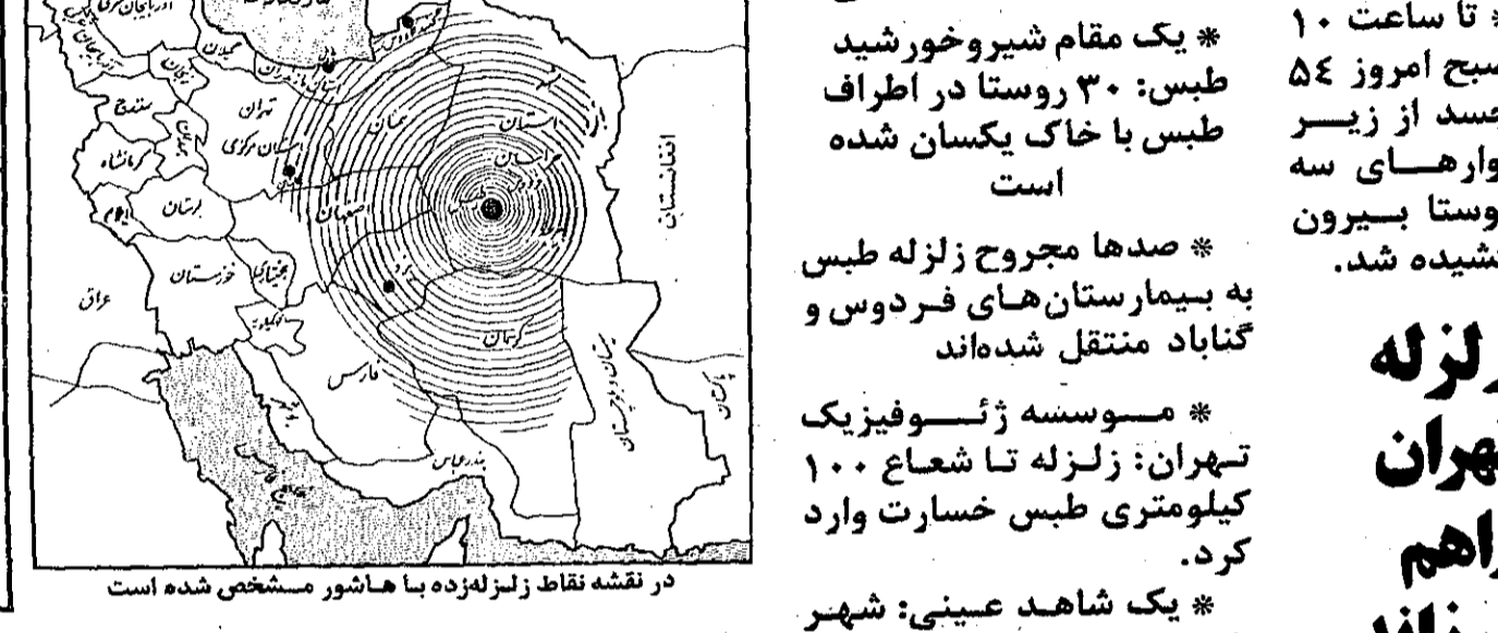
در نقشه نقاط زلزله زده با هاشور مشخص شده است

تا ساعت ۱۰ صبح امروز ۵۴ جسد از زیر آوارهای سه روستا بیرون کشیده شد. یک مقام شیروخورشید طبرس: ۳۰ روستا در اطراف طبرس با خاک یکسان شده است صدها مجروح زلزله طبرس به بیمارستان های فردوس و گناباد منتقل شده اند موسسه ژئوفیزیک تهران: زلزله تا شعاع ۱۰۰ کیلومتری طبرس خسارت وارد کرد. یک شاهد عینی: شهر طبرس در هم کوبیده شده و ساختمانها به صورت تلسلی از خاک و آهن درآمده است. شیروخورشید طبرس به کلی درهم کوبیده شده است. سرخ استان خراسان از طبرس گزارش داد: زلزله زدگان به چادر، پتو، دارو، پزشکی و مواد غذایی نیاز دارند. یک شاهد عینی: از هر خانواده یک یا دو نفر بیشتر زنده نمانده اند.