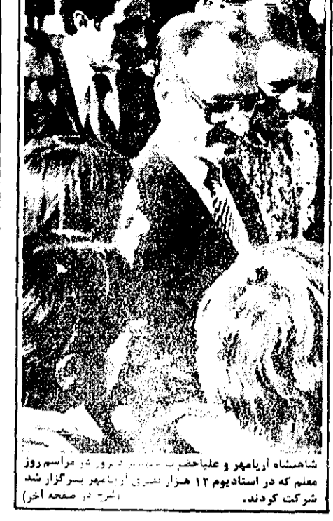
شاهنشاه آریامهر و علیاحمد... معلم که در استادبوم ۱۲ هزار نفری از آریامهر برگزار شد شرکت کردند.

دوشنبه ۱۷ مهر ۱۳۵۷ - ۶ ذیحده ۱۳۹۸ - شماره ۱۰۵۸۴