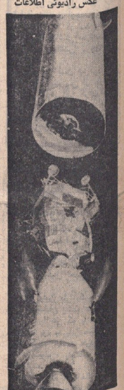
متصل شدن دو سفینه مادر و فرزند مأموریت بزرگترین و حساس ترین مأموریت است که فضانوردان باید یکبار هنگام خروج از مدار زمین و یکبار در مدار ماه انجام دهند اینکار در شب با اشکالات بزرگی مواجه شد و خطر تکرار آن در مدار ماه سبب شده که نامعلوم خود میروند نشان میدهد . احتمال نجات برنامه آیولو ۱۴ مورد بررسی قرار گیرد . در عکس چگونگی چه مشکلات بزرگی رویرو خواهند بود نشان شده است و سفینه هم نشان داده شده است .