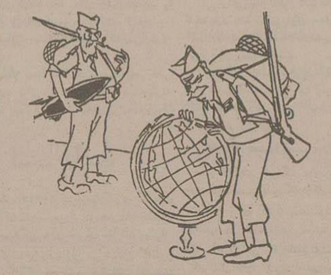
تو جستجوی هدف (گموی) دچار زحمت شهماند!

دولت عاملین کودتای اخیر را بشدت مجازات میکند کاراکاس - آسوشیتد پرس - های شددیدی برای هفدهم افسران دولتی که در نتیجه توطئه عملیات انقلابی در ونزوئلا اخیراً شروع به تصفیه ستگاههای دولتی نموده تا انتخابات آزاد برای اولین بار طی دهمسال اخیر بدون اشکال صورت گیرد. اکنون دولت پس از تسلط بر اوضاع و کوبیدن انقلابیون روز یکشنبه گذشته قصد دارد مجازات