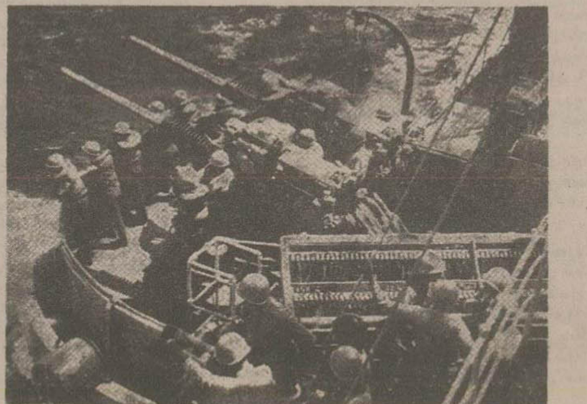
توپهای سنگین رزمناو امریکائی هملناه بطرف مواضع ساحلی چین کمونیست فراول رفته است. این توپها مترسند تادرسورت کوچکترین الدامی از طرف کمونیستها نسبت به کشتیهای امریکائی به کسی العمل بپردازند.

تایبه سرویتر - روز گذشته توبخانه چین کمونیست به گلوله باران کردن جزیره کوی ادامه داد و از پیاده کردن وسائل و خوار بار يك دسته از کشتیها تحت حمایت کشتیهای جنگی امریکائی جلوگیری نمود. چهار کشتی حامل خواربار و مهمات ملیون که قصد داشت در جنوب کوی محمولات خود را پیاده کند در نتیجه گلوله باران شدید کمونیستها ناچار عقب نشینی گردیدند. بقیه در صفحه چهارم