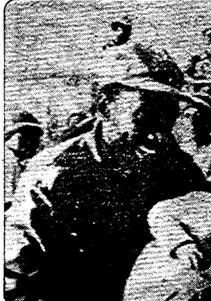
رزمندگان "سواپو" در میان خلق نامی بیا

اجرا، شورای امنیت سازمان ملل متحد، بار دیگر، برای رسیدگی به مسئله "نامی بیا" تشکیل جلسه داد. در این اجلاس، گروه کشورهای آفریقای، پیش نویس قطعنامه ای را به بررسی و رای گذاشت، که در آن مجازات همه جانبه و اجباری رژیم نژاد پرست آفریقای جنوبی طلب شده بود. هدف از این قطعنامه این بود، که با اعمال تدابیر تنبیهی، از جمله منع فروش و واگذاری نفت، و جنگ - افزار به رژیم "پرتوریا" دولت آفریقای جنوبی به پذیرش قطعنامه ۲۸۵ سال ۱۳۵۷ (۱۹۷۸) شورای امنیت، منتهی به خروج از نامی بیا و اعطای استقلال به این سرزمین وادار گردد. قطعنامه ۲۸۵ شورای امنیت، از جمله، خواستار: ۱- پایان بخشیدن به اغتفال غیر قانونی "نامی بیا" از سوی ارتش آفریقای جنوبی، ۲- شناسایی تمامیت ارضی کشور و فسخ سیاست "زادبوم" ها از سوی "پرتوریا"، ۳- آزادی همزندانان سیاسی، ۴- برگزاری انتخابات زیر نظرارت سازمان ملل متحد، ۵- بازگویی برگزیده از سوی آن، بنام "گروه تک صوت سازمان ملل متحد" ("پورتاک")، و ۶- با شرکت "سواپو" ("سازمان خلق جنوب باختری آفریقا") و برای تعیین مروتوش مردم "نامی بیا" به دست خویش، بشده بود. چنانکه انتظار صرفت، ایالات متحده آمریکا، بریتانیا و فرانسه، با رای وتوی خود، پذیرش این قطعنامه را مانع گردیدند. وتوی کشورهای امپریالیستی نمایانگر پشتیبانی بیگزار رژیم است که سرکوب اکثریت ساهیبوست را در داخل، با تجاوز آشکار به حقوق دیگر خلق ها در خارج، بهگونهای ددمنشانه و کستانخانه، تلفیق بخشیده است. هر