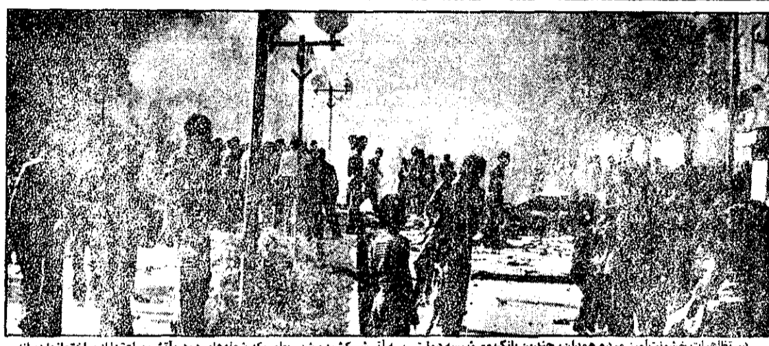
در تظاهرات خونین تاجریز مردم همدان، چندین بانک و موسسه دولتی به آتش کشیده شد، بطوریکه ششدهای دود و آتش، ساعتها از ساختمانها زبان می کشید. عکس: همدانی از یونان و یونانویز، که به تماشای یکی از ساختمانهای ویران شده ایستادند نشان میدهد.

در تظاهرات و تیراندازی تهران عده ای مجروح شدند استادان دانشگاه تهران و ملی متحصن شدند در چند شهر تظاهراتی به طرفداری از دولت برپا شد صفحات ۲، ۳، ۴