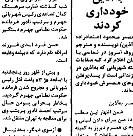
سرب کمال تصادی