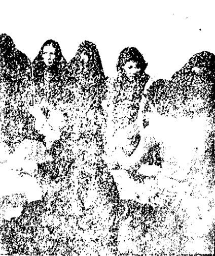
تقسیم بندی هائی است که اعتبار قانونی و قضائی ندارد.

چند روز دیگر منتظر باش: یک عمر راحت باش! چند روز دیگر منتظر باش: یک عمر راحت باش!