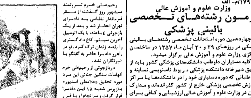
تقسیم بندی هائی است که اعتبار قانونی و قضائی ندارد.

چند روز دیگر منتظر باش: یک عمر راحت باش! چند روز دیگر منتظر باش: یک عمر راحت باش!