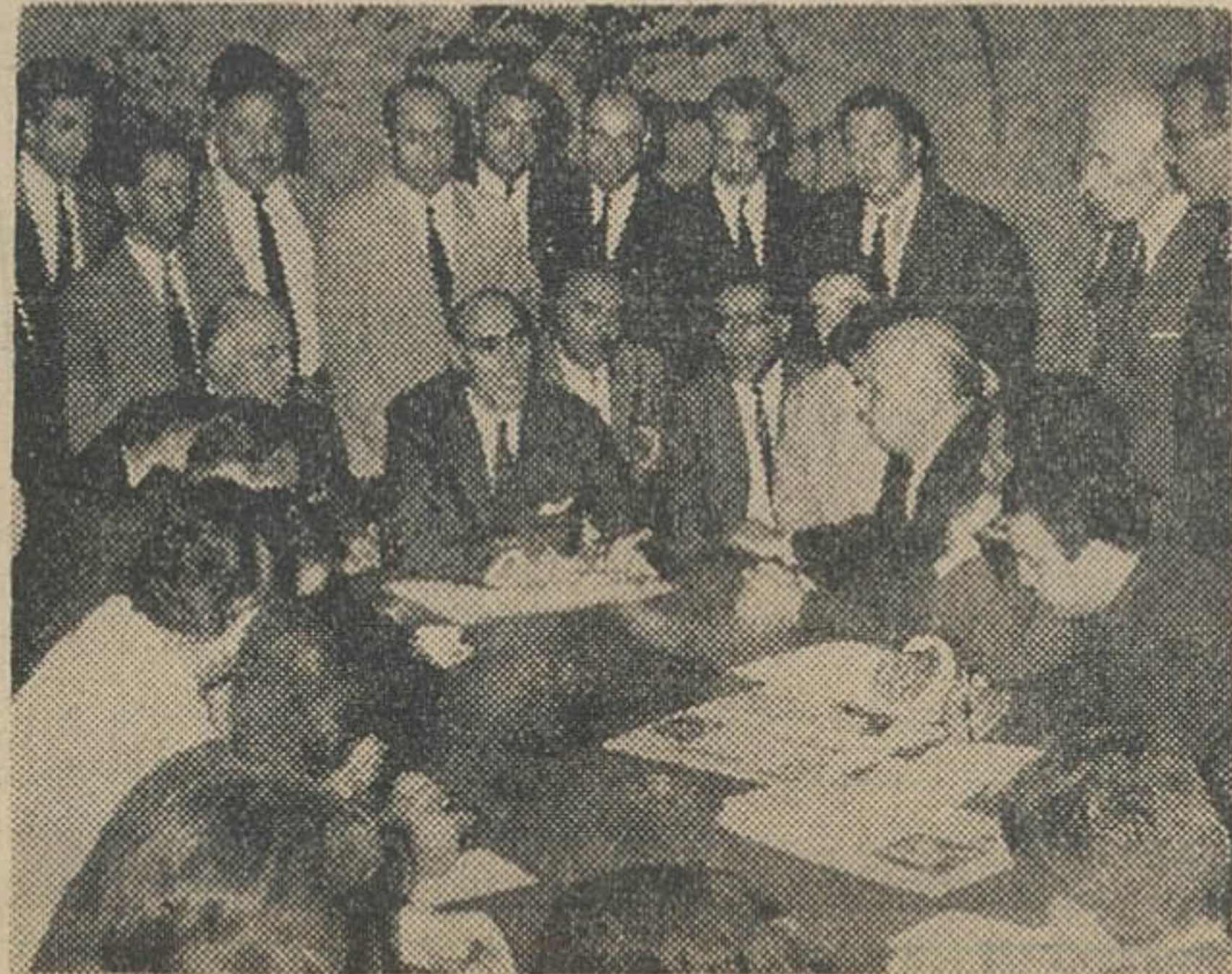
آقای پروفوسور عدل دبیر کل حزب مردم در جلسه مصاحبه مطبوعاتی

دیشب آقای پروفوسور عدل دبیر کل حزب مردم یک جلسه مصاحبه مطبوعاتی اعلام کرد که حزب مردم در انتخابات شرکت میکند و در آینده کاندیدا های حزب مردم معرفی می شوند.