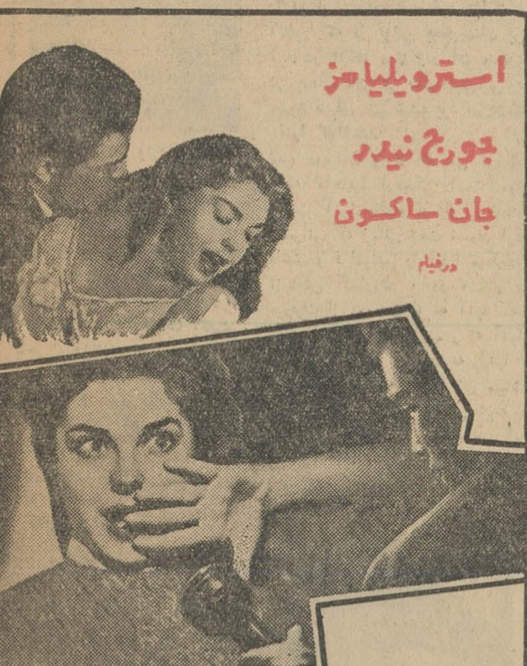
"THE UNGUARDED MOMENT"