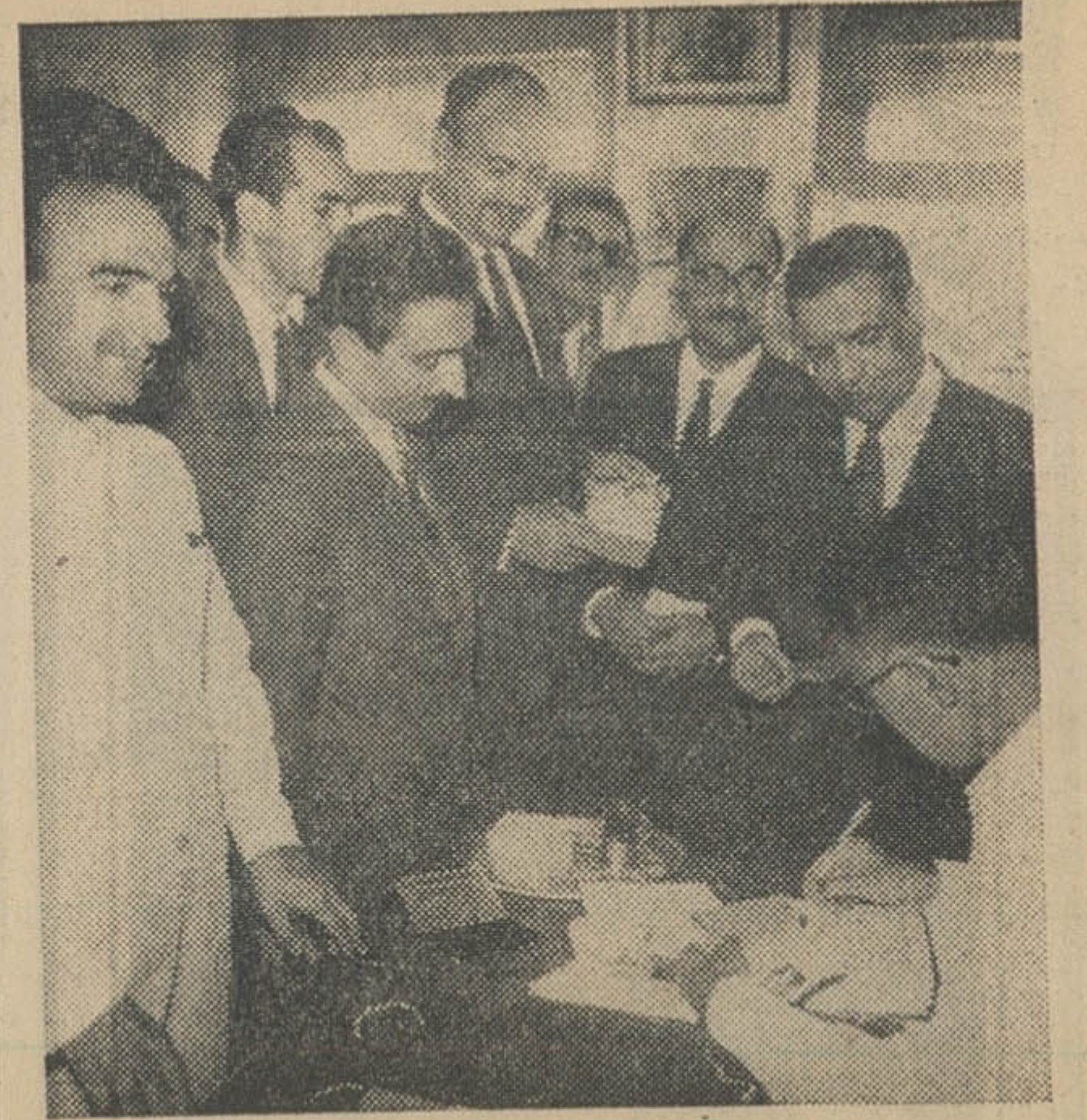
آقای خسروانی وزیر کار و جمعی از رؤسای این وزارتخانه برای دریافت کارت انتخاباتی بجزوه ثبت نام مراجعه کرده اند.

بقیه از صفحه اول گرددند گزارش میدهند: در دبستان استادیور دود تهران یازس امروز برخلاف دو روز گذشته بیشتر کسانی که برای اسمبلی می‌آید می‌گردند آقایان بودند. البته خانها هم مراجعه میکردند چنانکه درین آنها نونفر خانم که بیشتر از ۶۵ سال داشتند مشاهده شد که یکی از آنها با کمک دیگری به حوزه مراجعه کرده بود. همچنین در این حوزه دو خانم کمتر از ۲۰ سال هم مراجعه کردند که به آنها گفته شد طبق قانون نمی‌توانند رای بدهند.